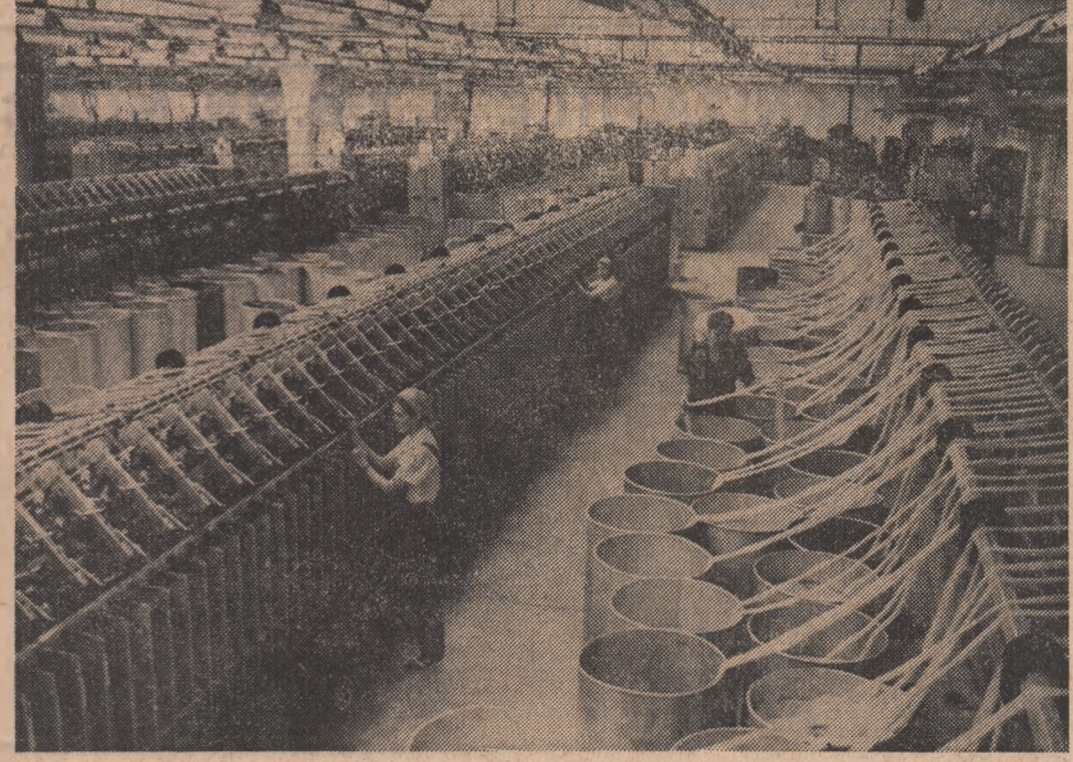
Noua întreprindere de covoare plușate din Siret, județul Suceava

Asupra modului concret de acțiune din secții am avut ocazia să aflăm amănunte de la ingineria Eugenia Colibaba, șefa secției țesătorie. „Încadrarea în costurile de producție pe acest an reprezintă una din sarcinile cele mai importante ce stau în fața fiecăria