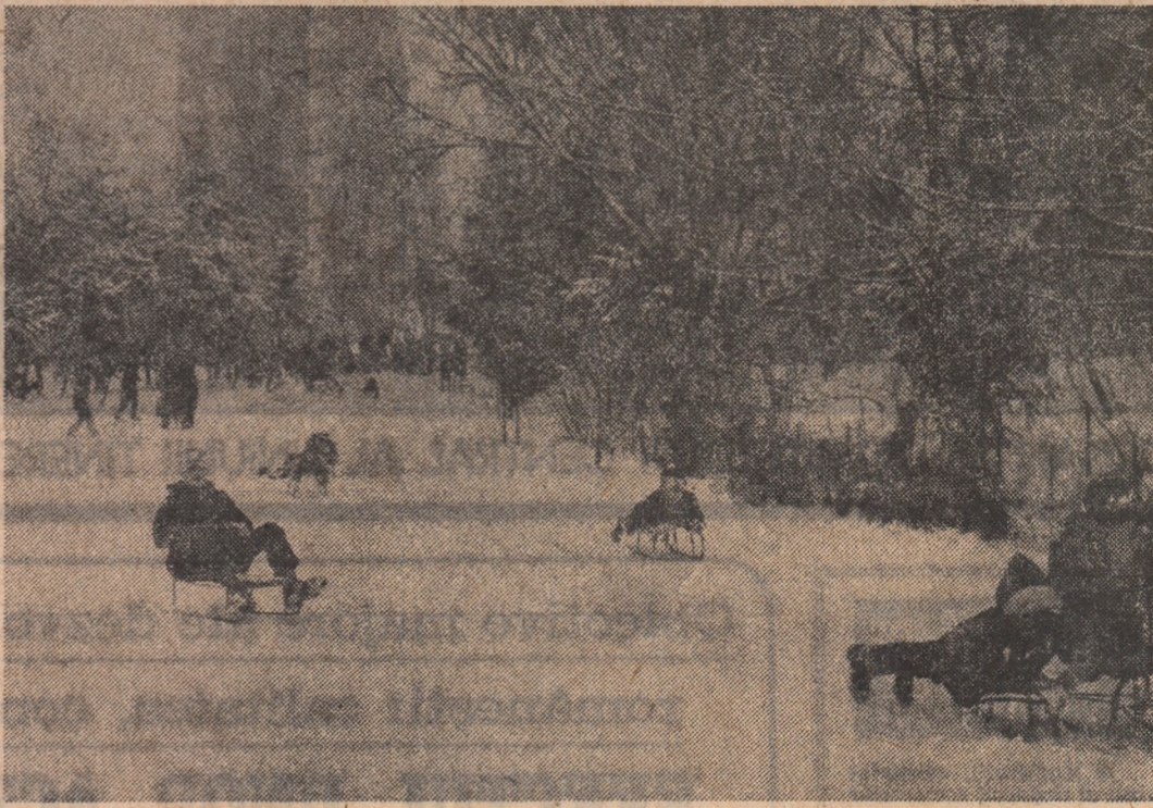
Deși pe alocuri au înflorit ghiocelii, vremea sănișului n-a trecut