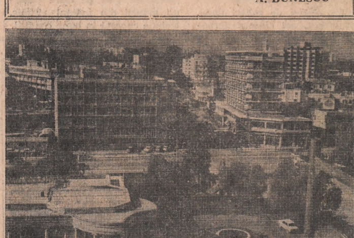
CIPRU — Imagine din Nicosia