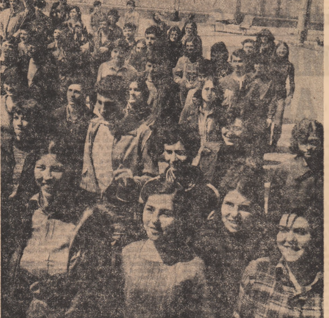
Tineri la primul interviu

În condițiile actuale, tinerii sunt chemați să participe activ la viața socială și să contribuie la realizarea obiectivelor naționale. Activitatea politică și educativă este deosebit de importantă în acest sens.