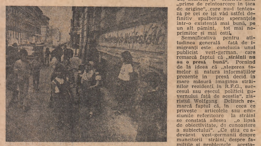
Imagine dintr-un cartier al imigranților turci din Berlinul Occidental

dera oriind”. Atitudinea față de imigranți exprimă, nu o dată, „o formă de rasism, la fel de odioasă ca antisemitismul”. Pînă în 1973, potrivit cotidianului parizian, dezvoltarea anarhică a unor fluxuri migratoare umane a reprezentat consecința firească a unei politici de căutare a mîinii de lucru convenabilă politică incurajată de autorități la acea vreme. Continentele de imigranți constituiau o forță de muncă docilă și puțin pretentioasă în ceea ce privește condițiile de viață. La rîndul lor, țările lumii a treia „vedeau în emigrație un remediu parțial la starea lor de subdezvoltare” („Le Monde”). Apoi, în perioada sfertului teoretic a independenței, în 1974, aceasta a continuat sub forma clandestinității și în condiții precare. Considerați ca o mînă de lucru în tranziție, imigranții au fost tratați ca atare: marginalizare la porțile orașelor, analfabetism, lipsă de calificare, somaj. Condițiile de locuit sînt și în prezent dintr-una cele mai proaste; peste trei sferturi dintre locuitorii insulbre din Franța sînt ocupați de imigranți; o sută de mii de familii asteaptă o locuință; numeroase apartamente sînt suprapopulate. În același timp, „nivelul de toleranță al populației din țara-gazdă este din ce în ce mai mic, im-