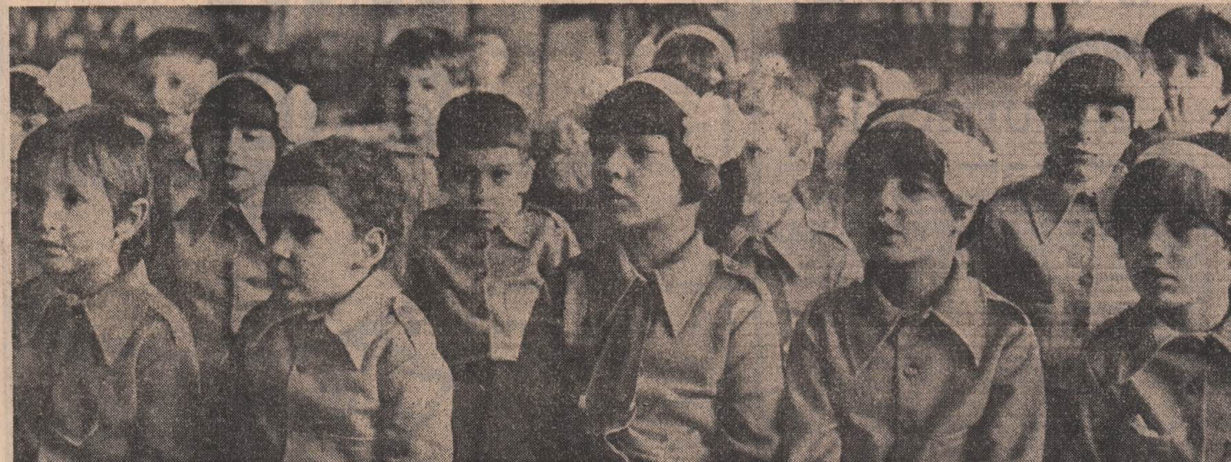
În pagina a III-a: ÎN BĂNCILE PRIMELOR LECȚII DE MUNCĂ ȘI VIAȚĂ