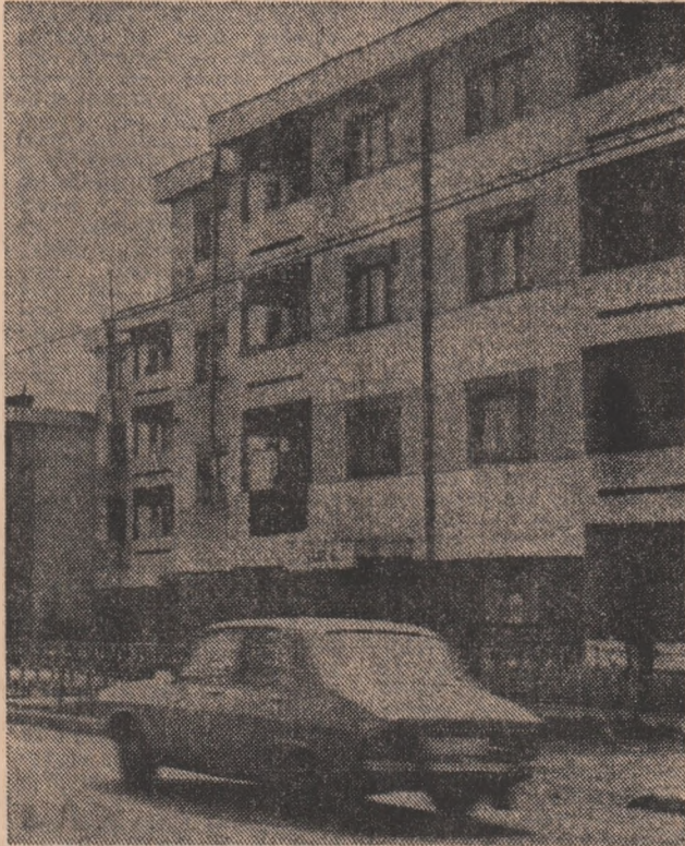
Imnuri urbanistice în comuna Răcari, județul Dimbovitza