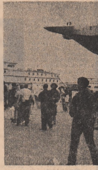
„Fonduri pentru lucrări de muncă, nu pentru război”, se poate citi pe o pancartă, în cadrul unei recente demonstrații, desfășurate în portul New York

Președintele Comitetului pentru pace din Yokosuka, Tadayoshi Yamaguchi, a subliniat, în cadrul mitingului care a avut loc, că instalarea unor asemenea arme de distrugere în masă pe navele militare ale S.U.A. ar fi în acastă bază periculoasă securitatea Japoniei și agravarea pericolului izbucnirii unui război nuclear.