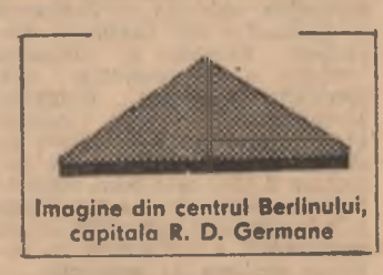
Imagine din centrul Berlinului, capitala R. D. Germane

NAȚIUNILE UNITE 5 (Agerpres). — În consiliul de Securitate al O.N.U. s-au încheiat dezbaterile în legătură cu plingerea Republicii Nicaragua privind continuarea actelor de agresiune împotriva teritoriului său. Membrii consiliului au fost scizati cu un proiect de rezoluție care, între altele, cerea tuturor statelor să se abțină să întreprindă, să sprijine sau să încurajeze orice fel de acțiune militară împotriva oricărei țări din America Centrală și prezenta încheierea imediată a unor astfel de acțiuni, precum și evitarea oricăror acte care năvălesc asupra libertății naționale și a drepturilor fundamentale ale omului. Ca urmare a recurgerii de către Statele Unite la dreptul lor de