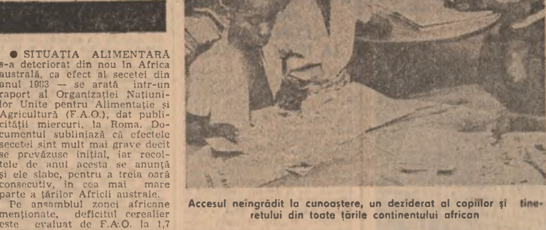
Accesul neîngrădit la cunoaștere, un deziderat al copiilor și tineretului din toate țările continentului african

După cum relatează agențiile internaționale de presă, timpul nefavorabil din regiunea de sud-est a Statelor Unite, unde se află platforma de lansare de la Cape Canaveral, nu a permis echipajului navei „Challenger” să efectueze ultimele antrenamente incluse în programul de pre-