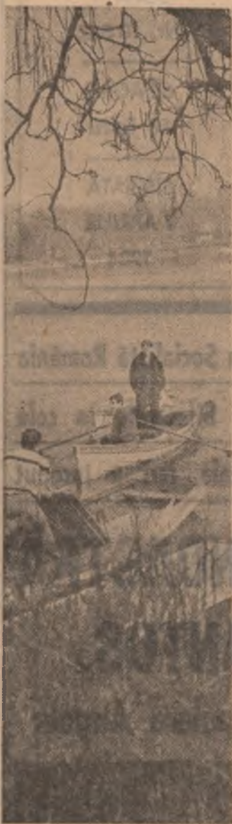
O plimbare cu barca pe lacul Herăstrău...