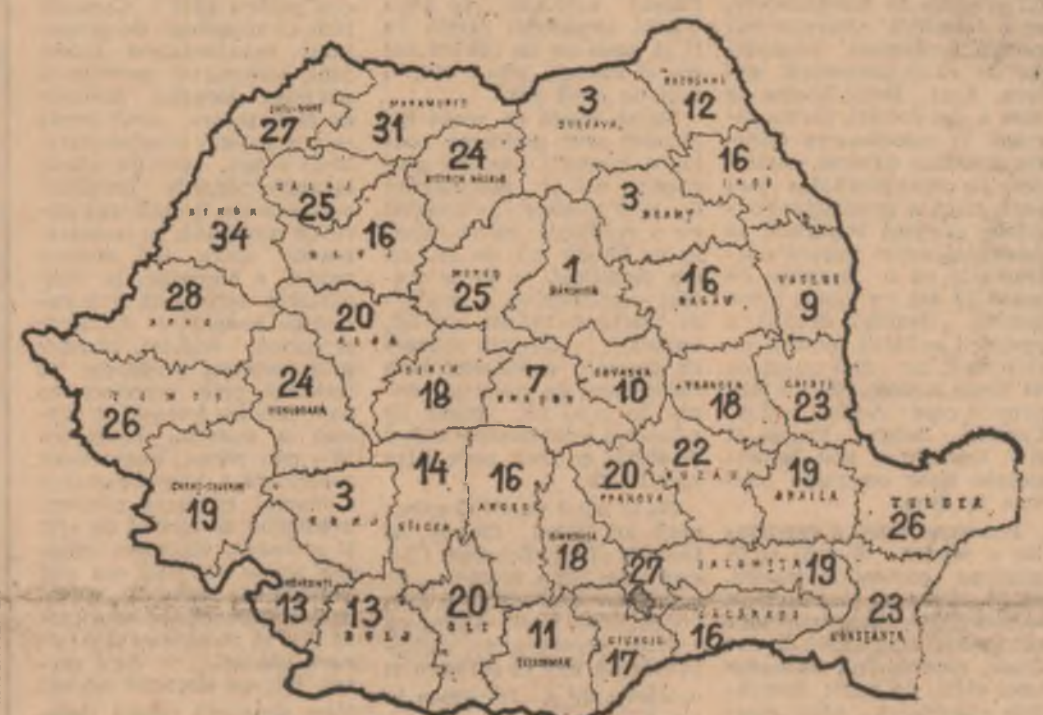
Stadiul însămînțărilor de primăvară — în procente —

Chiar în condițiile unor viteze sporite, trebuie să nu se admită NICI UN RABAT DE LA CALITATEA LUCRĂRILOR, FAPT HOTĂRÎTOR ÎN OBTINEREA RECOLTELOR RECORD