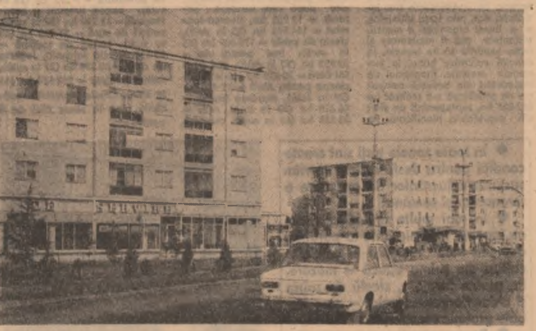
Construcții cu arhitectură modernă în localitatea Buștea din Sectorul agricol Ilfovești.