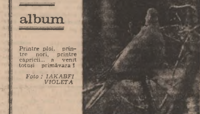
Printre plozi, printr-o noaptea primăvară, capricii... a venit totuși primăvara!