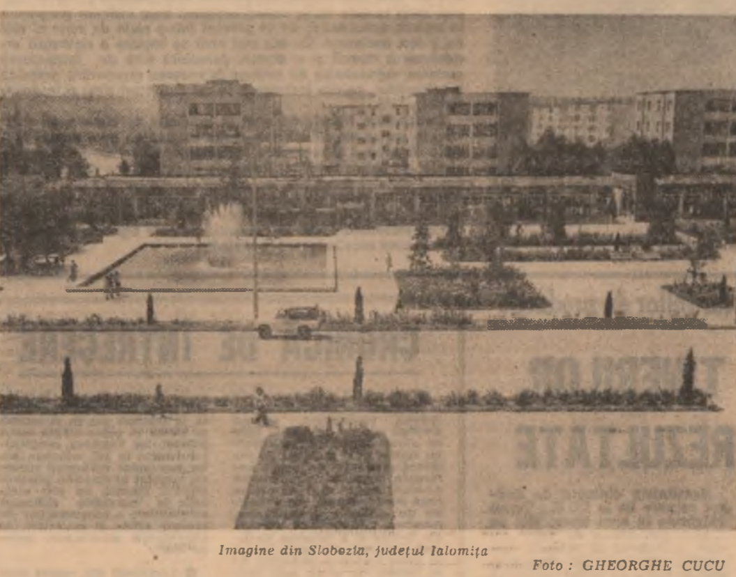
Imagine din Slobozia, județul Ialomița

„Eu cred că oamenii au inventat sărbătorile ca să-și aducă aminte de fetele, să se mai împlinească din când în când cu un cîntec, cu o glumă, cu o floare”. Să reținem îndurtoarea Lilianei A. și să le mai citim o dată la sfîrșitul rubricii de astăzi, stimați prieteni. Mariana spune: „Am prietenii să scriu unui mare actor, Sînclieț cunoscut peste tot. Nu cred că există un mare actor și în sensul material și în spiritual”.