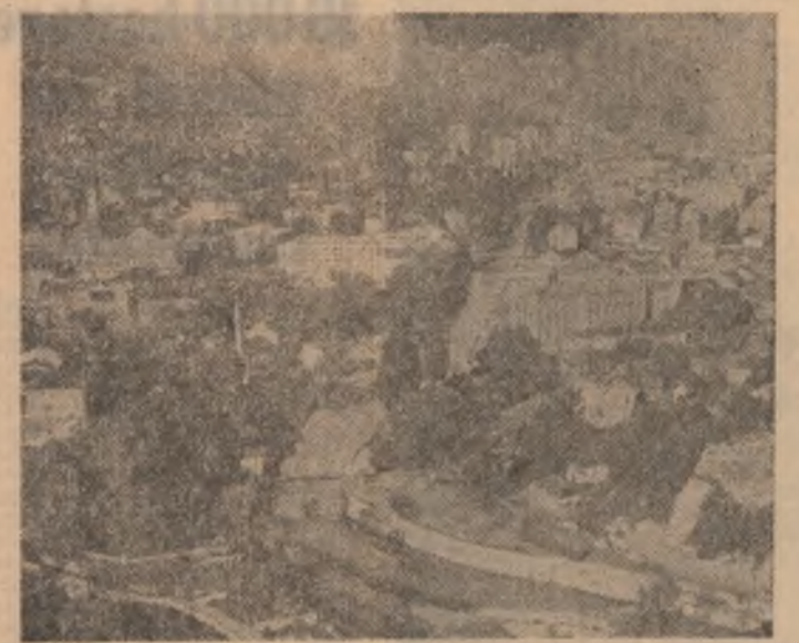
R.S.F. IUGOSLAVIA — Imagine din orașul Sarajevo

În provincia britanică Irlanda de Nord, continuă să se desfășoare noi acțiuni teroriste. Potrivit agenției Associated Press, miercuri dimineață, în clădirea de control vamal de la frontiera cu Republica Irlanda a explodat o bombă. Nu s-au înregistrat victime, dar explozia a declanșat un incendiu ce a determinat întreruperea activității.