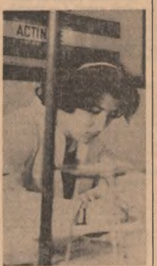
Olimpiadele școlare — un test semnificativ pentru starea de performanță a învățămîntului nostru