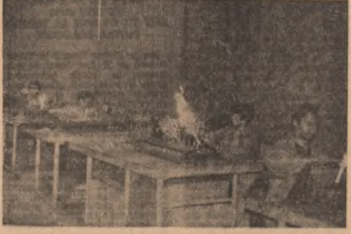
Tinerii din cadrul Intreprinderii „Eprubeta” din sectorul 3 al Capitalei își aduc din plin contribuția la realizarea sarcinilor de plan