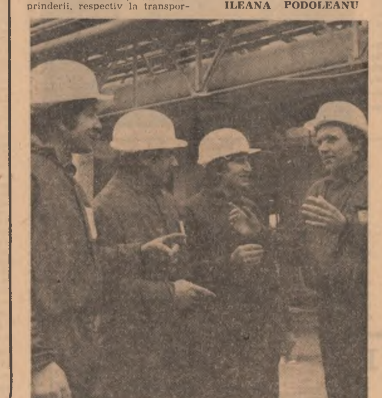
Un grup de tineri dintr-o organizație U.T.C. în timpul unei activități comune.

metrul infracțiunilor sancționate de lege.