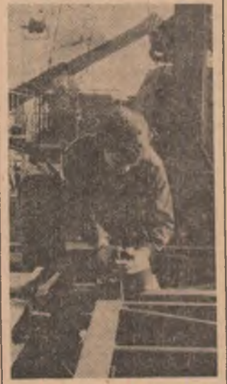
Organizațiile U.T.C. — în munca lor de zi cu zi