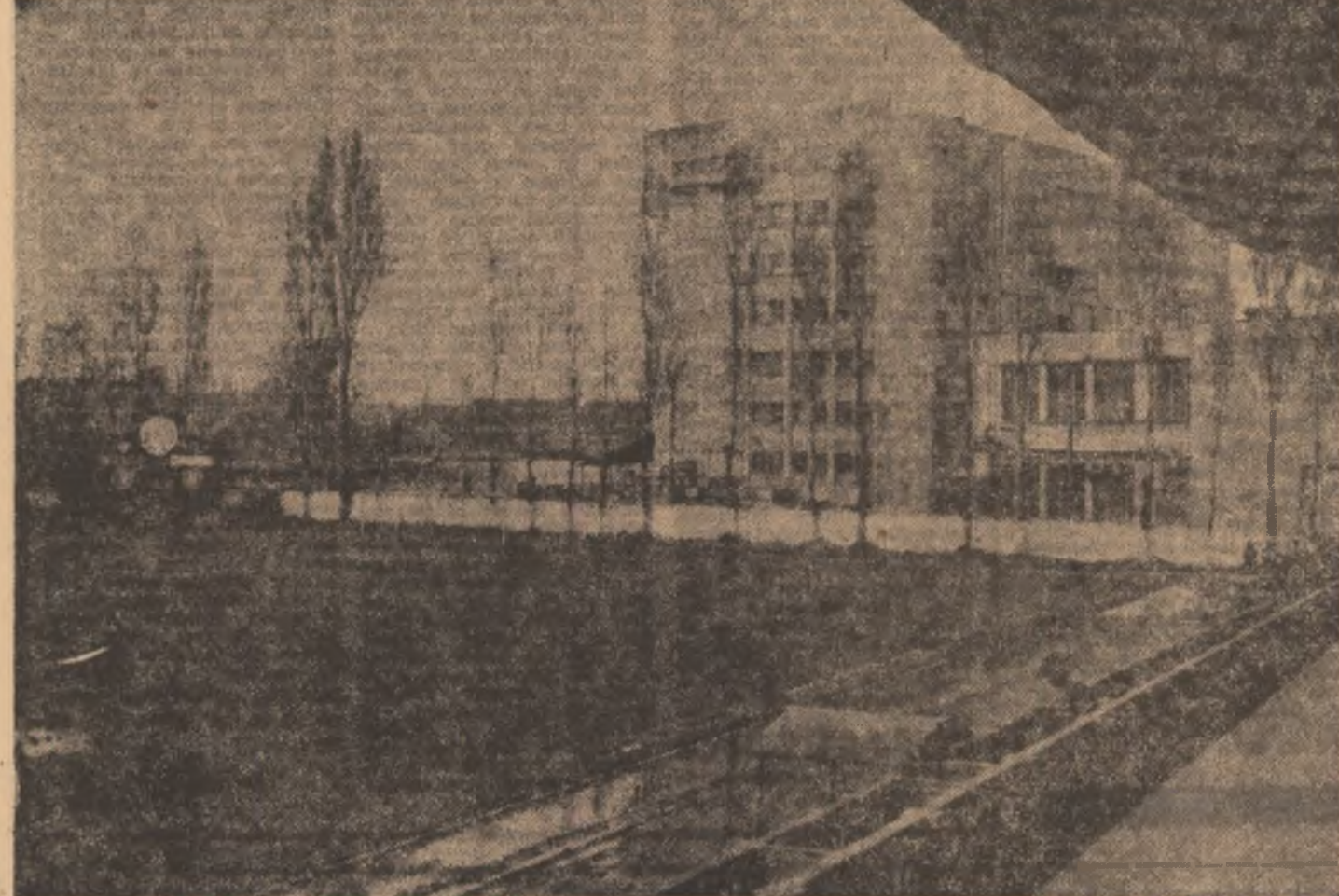
Stadionul muncitoresc (azi baza sportivă „Electromagnetica”) — unul din multele locuri de semnificație și rezonanță în istoria Bucureștiului și deci a țării