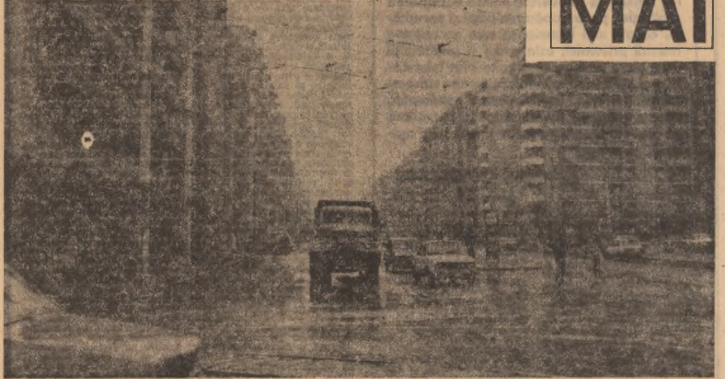
...o realitate prin care Bucureștiul întâmpină viitorul

proiectată apară și tu și, deci, nu-ți este indiferent cum vei arăta), însă, dacă omisiunea este (sau nu este) justificată, ea are în schimb adînci semnificații: lumea cartierelor Bucureștiului, lumea muncitorească era băgată în seamă abia cînd își făcea apariția în lumea centrului, adică atunci cînd se atrăgea atenția că oamenii sînt liberi și sînt egali (sau trebuie să fie liberi și egali) și au, asadar, aceleași aspirații, necesități, vizează la fel. Lumea muncitorească nu se vede prea mult în pozela Bucureștiului din anii '30, dar, dacă lumea nu se vede, se arată foarte limpede ceea ce făcuse această lume din București, pentru că la temelia oricărui împliniri a orășului se așeza munca lor de zi cu zi.