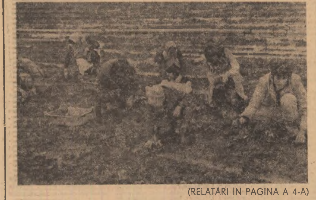
(RELATĂRI ÎN PAGINA A 4-A)

Si în legumicultură, ca în toate sectoarele agriculturii, exigentele actualei campanii agricole impun pretutindeni o bună organizare a muncii și rezultate zilnice pe măsura graficelor stabilite. Orice întârziere la efectuarea lucrărilor din grădinite de legume influențează direct nivelul recoltelor și, de aceea, cu toate