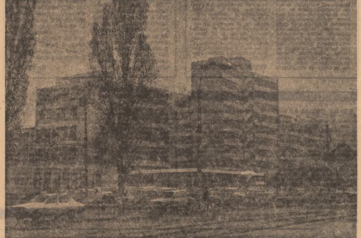
Întreprinderea „Electromagnetica”