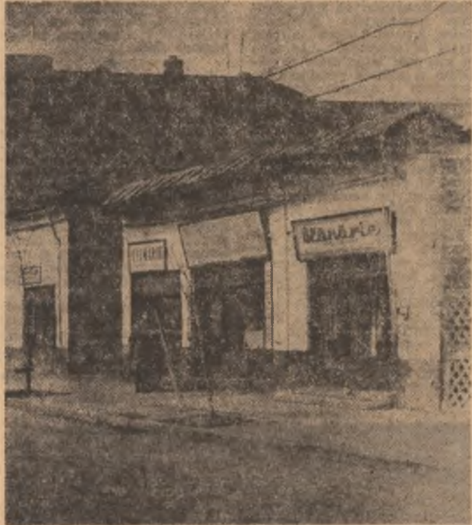
Calea Rahovei — între amintiri care au fost realitate și...

Bucureștiul înseamnă, în primul rînd, istorie. Din orice parte ai porni, pe orice drum ai intra, istoria te va înlimpina, persistent ca un sentiment de adolescent, urmărindu-te vreme îndelungată. Și e firesc să fie așa: pentru că dacă un botanist ghește în secțiunea unei frunze formă, caracteristicile întregului, tot astfel un om poate afla dintr-o secvență, dintr-un eveniment drumul, parcursul și implicațiile istorice ale întregului, adică ale unui oras și mergînd cu raționamentul pînă la capăt, adică ale unei țări. În această evoluție o sărbătoririi zilei de 1 Mai se reflectă, ciadar, un drum istoric, drumul clasei muncitore de la încercarea sa de a se stabili ca o clasă distinctă (cu nevoi, cu cerințe și aspirații distincte), pînă la înțelegerea rolului său în istorie. De la marea manifestare antimilitaristă și antifascistă de la 1 Mai 1939 — pînă azi, 1984, drumul clasei muncitore înseamnă, practic, un argument pentru istoria zilelor noastre. Istoria — care nu judecă nici cu minutul, nici cu ziua, nici cu anul — are acum o perioadă spre o putea spune cu excitație îndreptățită cu fost aspirațiile, drepte au fost revendicările, revoluționare visole. Iar ca temeii al dreptății judecării sale îl arată Orșul.