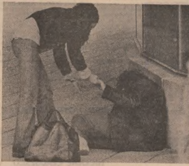
Consumul de droguri — un efect al dezechilibrului moral și o cauză a dezechilibrului fizic. Instantaneu surprins pe o stradă din Stockholm

După multă vreme, erau din nou în casa părintească adunați în jurul mesei. Se simțeau bine împreună. Duminică seara, cei trei băieți povesteau ce-au mai făcut peste săptămână. Tatăl îi privea mulțumit cum mâncău. Rideau cu poftă la sfârșitul glumelor. Mama făcea mereu drumul până la bucatărie și se hrănea mai mult cu bucuria acestei serii tihnite decât cu mâncarea. La un moment dat, în vîrstă de 18 ani se droga cu heroină, desigur, în fafuri. Mauro vine la bucatărie și cu vocea tremurîndă spune: „Mamă, am nevoie de ceva bani, dar repede.“ După refuz, intervine incredibilul: fiul scoate pistolul și trage, de aproape, în pieptul care-l hrănea, ocrotit, încălzit, lătrău... În timp ce frații și tatăl se precipită spre bucatărie, Mauro Coda, în vîrstă de 26 de ani, fuge în noaptea împreună cu alți doi tineri care-l așteptau afară.