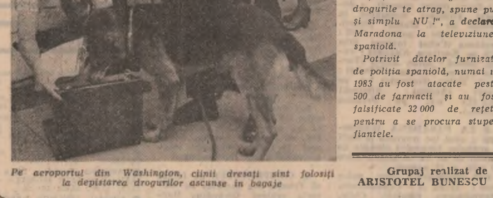
Pe aeroportul din Washington, cîinii dresați sînt folosiți la depistarea drogurilor ascunse în bagaje

Autoritățile spaniole au apelat în campania lor continuă antidrog chiar și la popularitatea de care se bucură nu numai în această țară fotbalistul Argentinian Diego Maradona care activează la F. C. Barcelona a apărut din nou pe micile ecrane dar nu pentru a-i umi pe telespectatori cu tehnica sa individuală, ci pentru a-i avertiza pe tinerii spanioli împotriva consecințelor nefaste ale consumului de droguri. „Bucură-te de mișcă și uită de droguri. Dacă drogurile te atrag, spune pur și simplu NU“, a declarat Maradona la televiziunea spaniolă. Potrivit datelor furnizate de poliția spaniolă, numai în 1983 au fost atacate peste 500 de farmacii și au fost falsificate 32.000 de rețete pentru a se procura stupefiante.