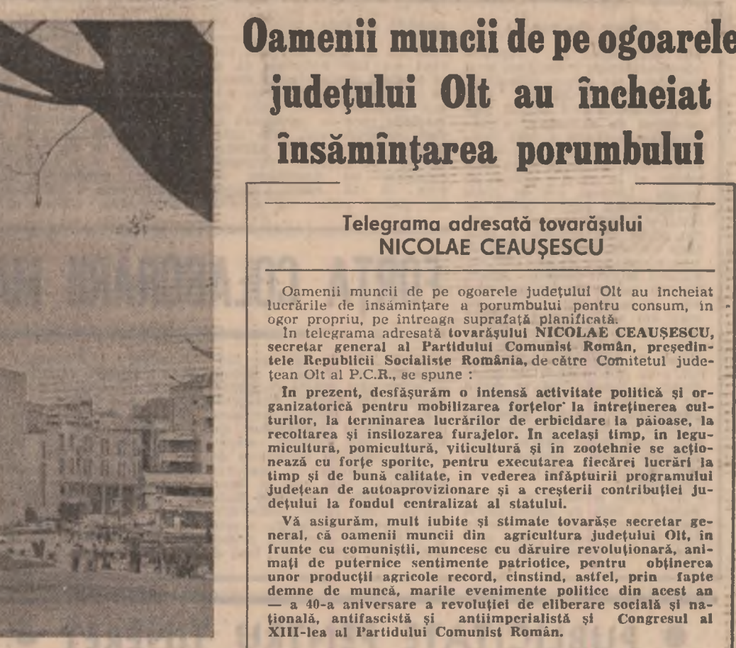
Rm. Vilcea