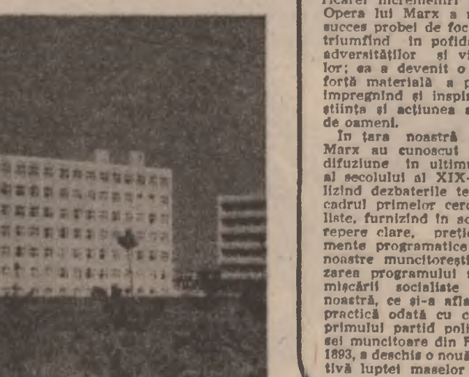
Exemple de munca și viață didactică ale Institutului agronomic Timișoara