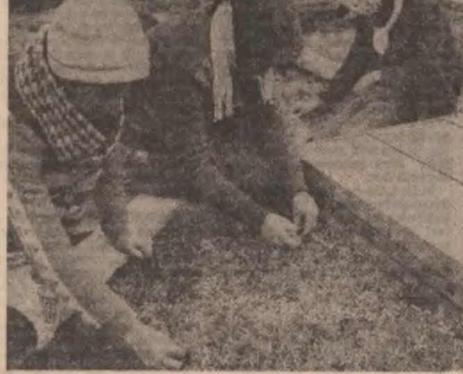
În răsădirile biologice se pregătesc materialul de plantat pentru înfrunțarea culturilor de ardei și vinete în timpul optim