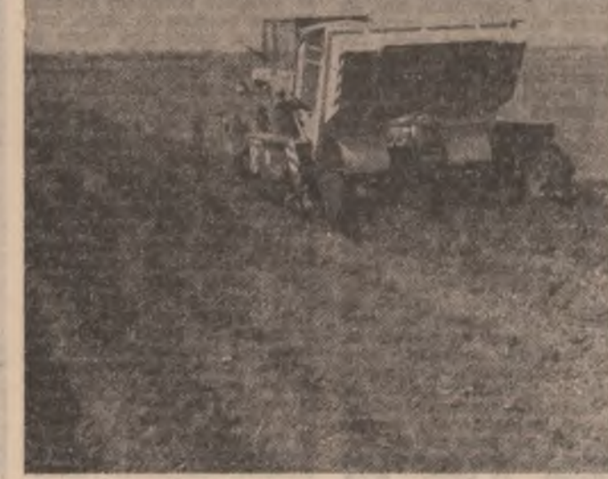
Plantarea cartofilor s-a realizat la cei mai înalți parametri calitativi, folosindu-se mașini de mare randament

Odată cu îmbunătățirea vremii, pe ogor s-a trecut la forța sporită la urgentarea semănăturii și la efectuarea lucrărilor de întreținere a culturilor prăstioare. După cum rezultă din ultimele date centralizate la Ministerul Agriculturii și Industriei Alimentare, în dimineața zilei de 4 mai, suprafața rămasă de semănat totaliza 848.900 de hectare, din care 301.709 hectare cu porumb, 46.000 hectare cu soia și 82.200 de hectare cu fasole. De menționat că semănatul porumbului și al altor culturi de primăvară s-a încheiat în 19 județe și în sectorul agricol Ilfov. Lucrarea este rămasă în urmă în unitățile agricole cultivate din județele Prahova, Dimbovița, Argeș, Vrancea, Bacău, Neamț, Brașov, Covasna și Suceava. Odată cu încălzirea vremii se impune ca în toate unitățile agricole să se treacă cu toate forțele umane și mecanice la pregătirea terenului și la semănat, folosindu-se în acest scop fiecare ora și zi bună de lucru, precum și toate utilajele din dotare și cele venite în ajutor din alte unități în vederea terminării de urgență a însemnăturilor de primăvară pe toate suprafețele planificate.