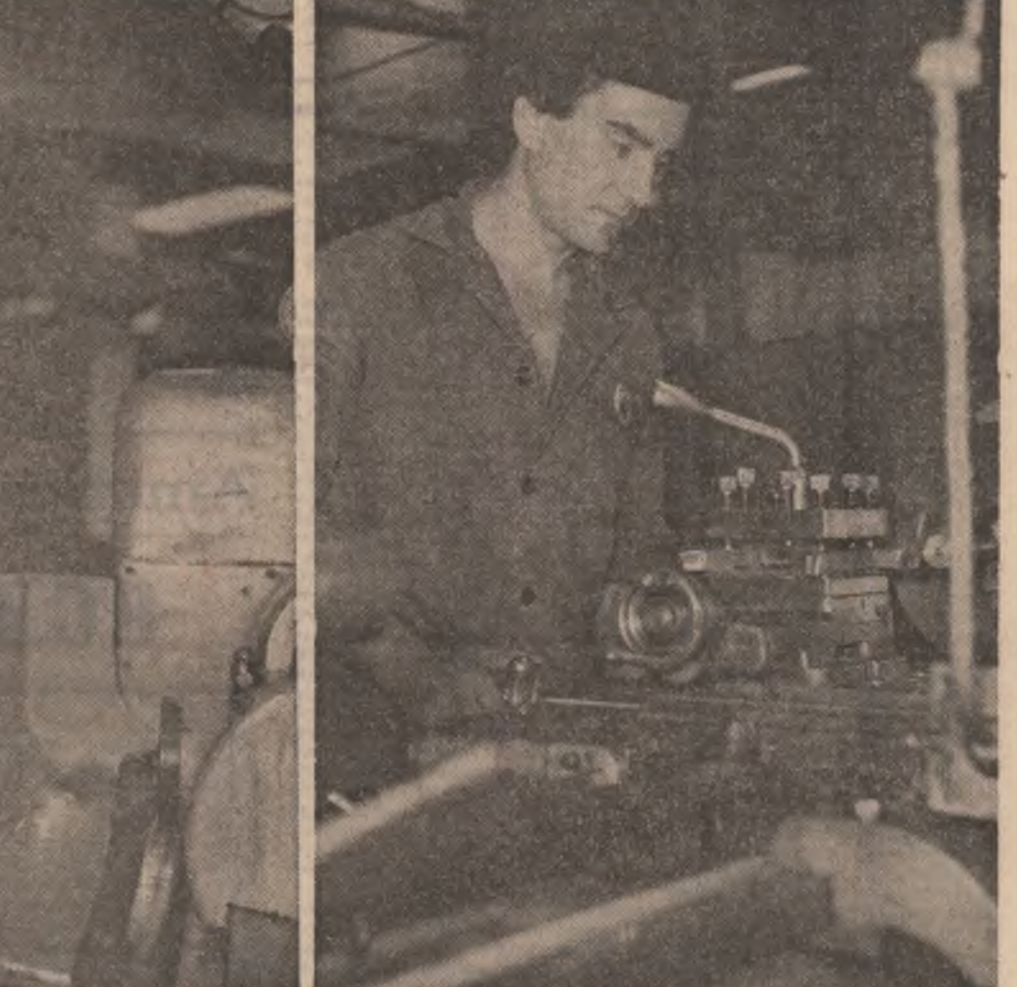
Pagină realizată de STEFAN MITROI

Astăzi, și pare întocmită din nou înfrădătoarea celorlalte sate, înfrădătoarea de acum, firește. El bine,