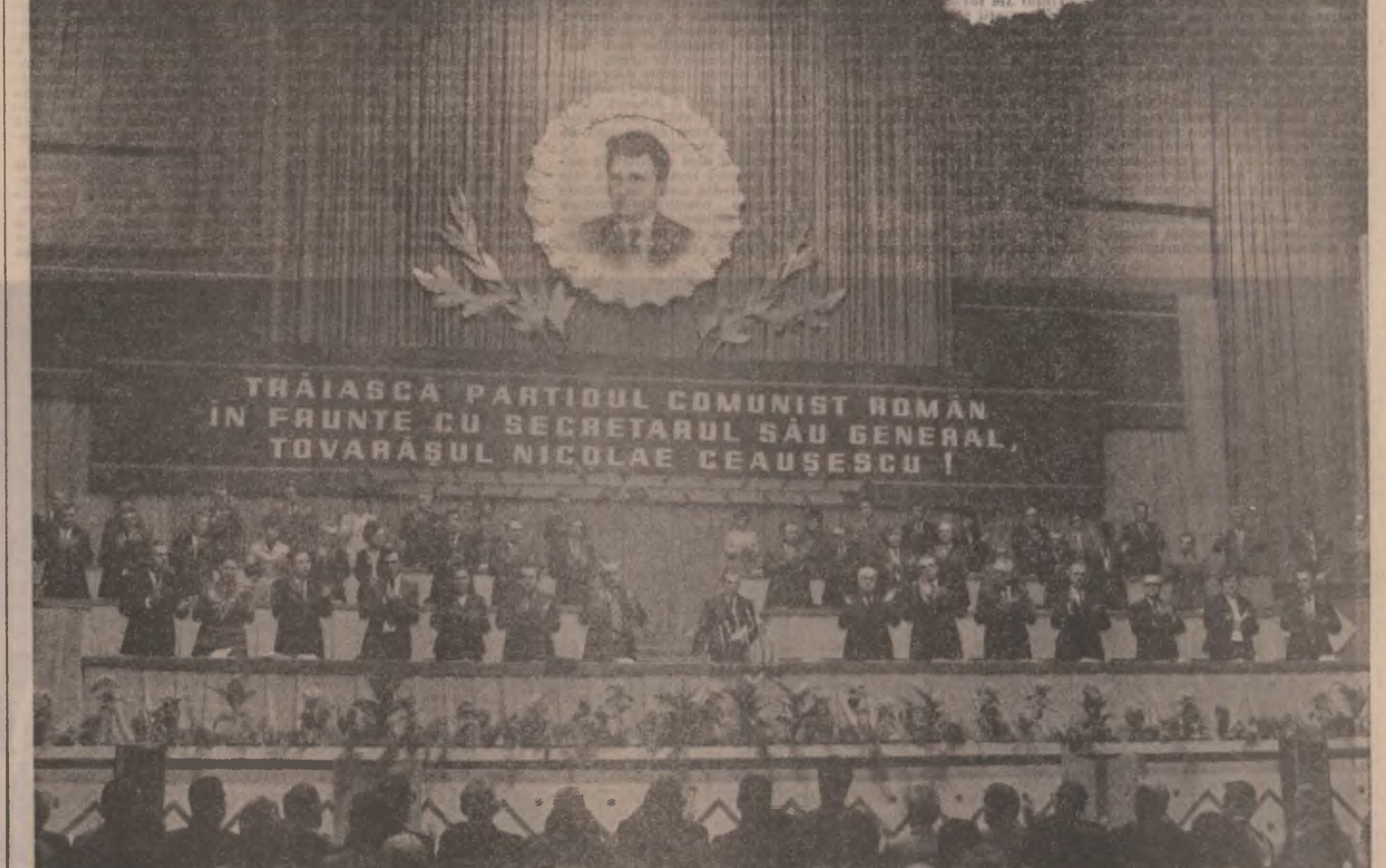
(Continuare în pag. a III-a)

S-a dat astfel glas angajamentului patriotic de a cînta cu noi și înălțătoare fapte de muncă, cu împliniri tot mai rodnice cele două evenimente de seamă ale acestui an — a 40-a aniversare a eliberării patriei și Congresul al XIII-lea al Partidului Comunist Român.