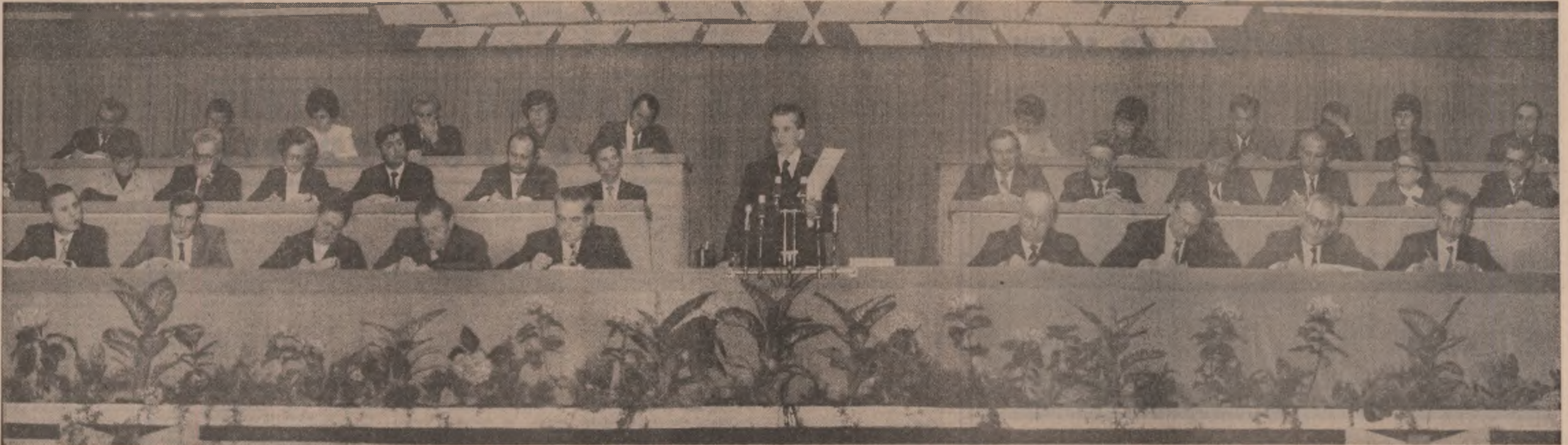
(Urmare din pag. a II-a)

materiale, sporirea eficienței economice și a beneficiilor, nu vom putea asigura ca această creștere a retribuției să fie reală, adică nu vom putea menține sub control prețurile. Noi am stabilit ca anul acesta să nu se realizeze nici o creștere a prețurilor, nici în industrie, nici la bunurile de consum. Sintem hotărâți să realizăm aceasta — și avem posibilitatea să facem acest lucru și trebuie să-l facem! Înă trebuie să înțelegem că pentru a asigura creșterea retribuției reale este necesar să creștem productivitatea muncii și beneficiile, ca în fiecare sector activitatea să fie rentabilă.