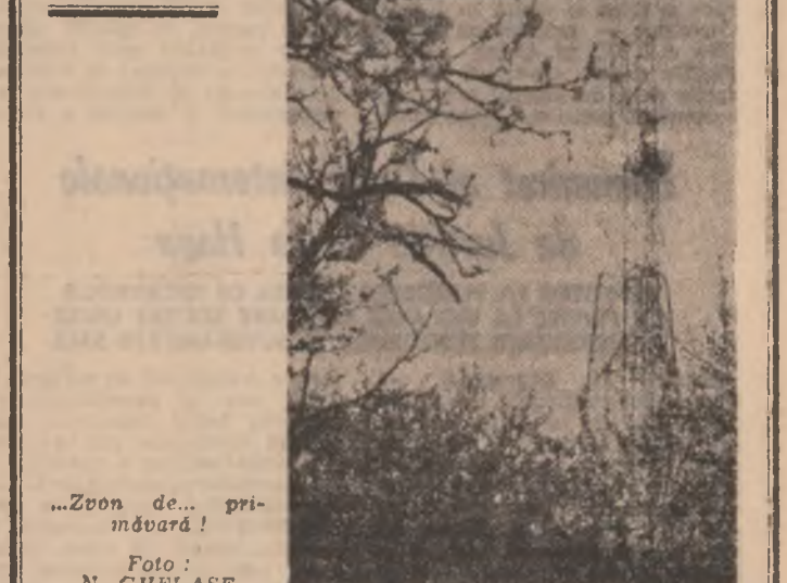
„Zvon de... primăvară!”