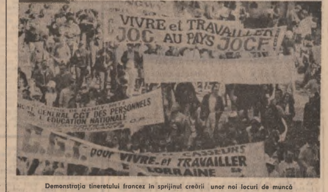
Demonstrația tineretului francez în sprijinul creării unor noi locuri de muncă

După estimările specialiștilor, anul acesta peste 11,5 milioane de tineri din 12 țări occidentale industrializate vor șoma. Într-un raport, dat publicității la Paris de Organizația pentru Cooperare Economică și Dezvoltare (O.E.C.D.), se arată că tinerii între 19-25 de ani sînt cei mai puternic loviți de creșterea considerabilă a șomajului, în această perioadă de recesiune, cînd criza economică se face încă puternic resimțită în țările respective. Doace multă parte din tinerii aflați în această situație de ingrijorătoare, cu efecte dîntre cele mai nocive asupra vieții și comportamentului tinerilor, riscul de a deveni șomer este în medie de trei ori mai mare pentru tineri decît pentru restul populației. În această situație milioane și milioane de tineri mai ales din Spania, Italia, Franța, Marea Britanie, Australia și Canada, unde rata șomajului juvenil se situează între 21,5 și 43,5 la sută, își vîd speranțele spulberate. Li se refuză unul din cele mai elementare drepturi: dreptul la muncă, la o viață demnă, lipsită de grija zilei de mîine. În aceste cazuri problemele individuale se generalizează, lovind ur tineri în perioada cea mai fragilă a vieții lor: atunci cînd do-