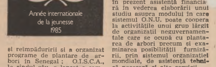
Année internationale de la jeunesse 1985

și reimpăduririi și a organizat programe de plantare de arbori în Senegal; O.I.S.C.A., la rândul său, a lansat o campanie intitulată „Love green” (E.O. născătoare au fost desfășurate mai multe campanii de plantare de arbori în India, Nepal, Sri Lanka, Thailanda etc. Mai multe țări și o instituție specializată a O.N.U. au organizat, în cadrul națională a arborelui și o zi a pădurii. Astfel, în Marea Britanie, sezonul de plantare a arborilor (perioada noiembrie-martie) a fost deschis de o săptămîna la arborele, în India ziua de 15 august a fost proclamată ziua plantării de arbori iar, potrivit hotărîrii F.A.O., născătoare au fost desfășurate, la 21 martie, Ziua internațională a pădurii, acțiune la care sint atrasi tot mai multi tineri. Mai multe institutii specializate și organe ale O.N.U. executînd programe privind tineretul au sprijinit ideea