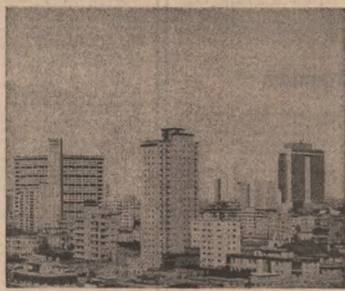
CUBA: Clădiri noi, moderne în Havana, capitala țării