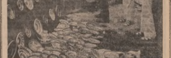
Întilnirea la Horezu

Argeș. La Combinatul de articole tehnice din cauduc — Pitești — arc loc o dezbatere pe tema „Calitatea producției, factor important în creșterea competitivității”. Bacău. În cadrul „Săptămânii record în producție”, peste 4.000 de tineri din 12 unități economice își propun să realizeze peste plan 4 garnituri de mobilă, reconstrucția a 200 de bucăți de scule, repararea a 250 mp țesături, 200 bucăți confecții, montarea și echiparea a 4 panouri de comandă în valoare de 1.500.000 lei. Gorj. Tinerii din centrul industrial-școlar Rovinari și Mitră realizază în aceste zile peste plan lucrări de reparații și revizii la utilajele din carieră, la excavatori și transportat 35.000 tone carbune și 120.000 mc steril, lucrări a căror valoare totală însumează 750.000 lei. Gurgu. La lucrările de plantat legume în cimp, prăsit floarea-soarelui și sticla de zahăr pe 26 de hectare sînt prezenți în aceste zile peste 2.500 de tineri. București. La Ecran-club arc loc o dezbatere pe tema „Teatrul, tribuna a educației politice”. Vaslui. La Stația de utilaj construcții din Husi arc o dezbatere pe tema „Știința în analiza și rezoluția, forme și modalități folosite de organele și organizațiile U.T.C. pentru prevenirea și combaterea fenomenului mistico-religios în rîndul tineretului”.