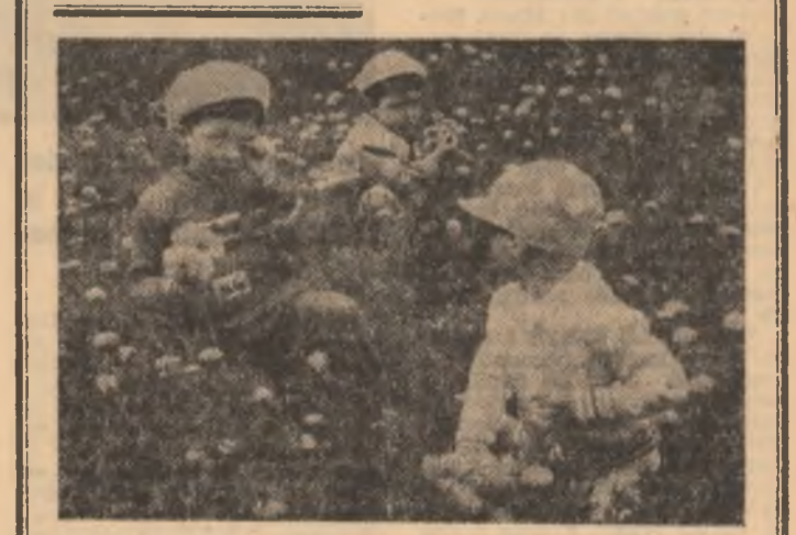
Splendoare în iarbă