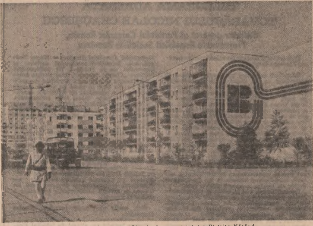
O imagine din noua arhitectură a municipiului Bistrița-Năsăud