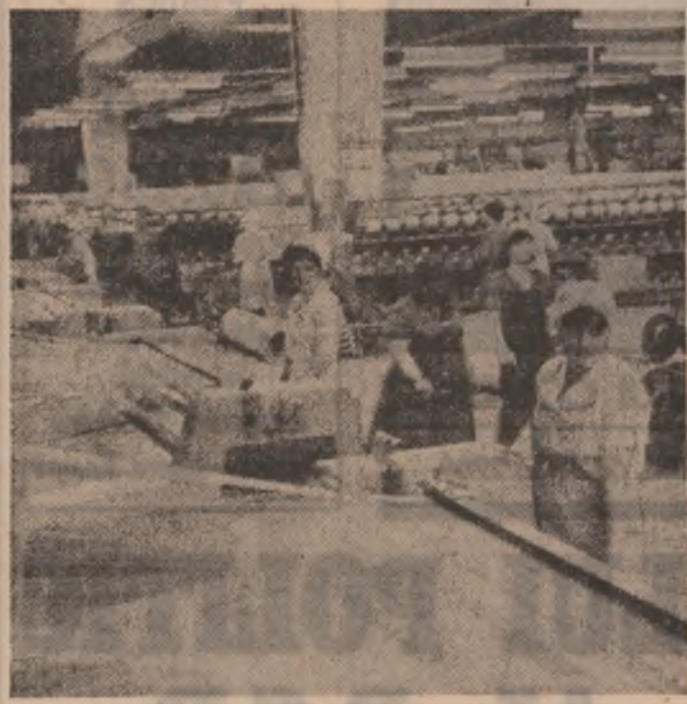
Întreprinderea textilă „Dunărea” din municipiul Giurgiu