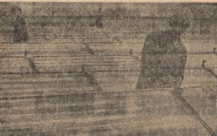
La Rîmnicu Sărat, soarele și vîntul „colaborează” îndeaproape cu localnicii pentru economisirea energiei