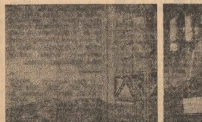
Prin-o tehnologie bine pusă la punct, „munții” de cioburi din imagine se transformă în milioane de butelii, de alte produse presate din sticlă și profilat