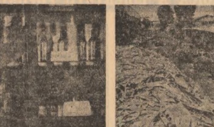
Pînă nu de mult acest depozit de resturi de marsei lua proporții îngrijorătoare de la o zi la alta. Acum, urmare a preocupărilor tinerilor specialiști de la I.G.F.E. Rîmnicu Sărat el se micșorează vizibil