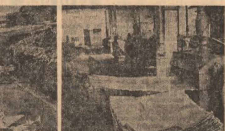
Pînă nu de mult acest depozit de resturi de marsei lua proporții îngrijorătoare de la o zi la alta. Acum, urmare a preocupărilor tinerilor specialiști de la I.G.F.E. Rîmnicu Sărat el se micșorează vizibil