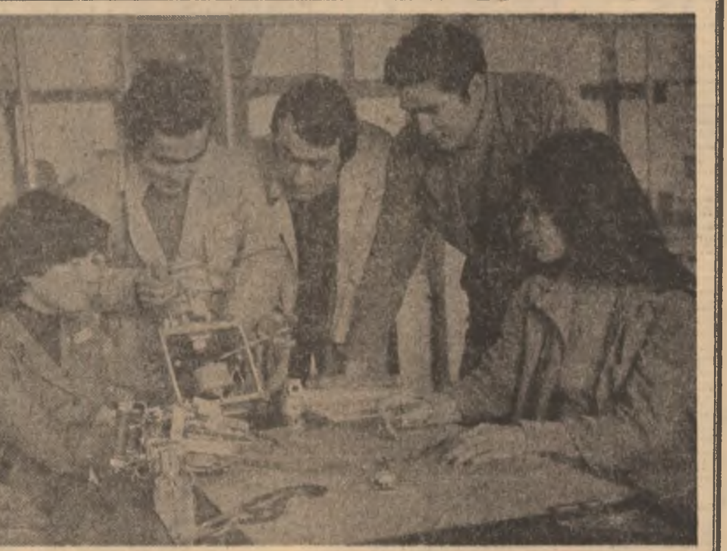
plîn, la vremea respectivă, că merită să fie promovată în categoria imediat superioară de încadrare și așa s-a și întîmplat. Noi le-am mai cerut încă ceva, pe lângă cunoștințele practice și teoretice din plin demonstrate: fiecare să propună cel puțin o soluție concretă de diminuare a consumurilor, de creștere a eficienței activității din secția noastră. Și efectiv fiecare lucrător din atelierul matrice se poate lăuda că a propus și a finalizat cel puțin o astfel de soluție, fiecare soluție echivalînd cu sute și sute de kilograme de metal prețios economisit, superior valorificat.

— Da, și o să vă explic. Fără excepție, toți cei care lucrează în secția noastră, mulți dintre ei tineri, și ei mine sau chiar mai tineri, sînt bine pregătiti profesional, capabili fiecare să execute orice operație, orice produs, oricît de complex ar fi el. Cu toții au dovedit pe de-