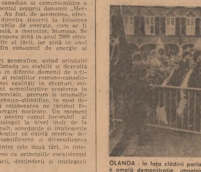
OLANDA : În fața clădirii parlamentului din Haga a avut loc recent o amplă demonstrație împotriva desfășurării de rachete nucleare americane cu rază medie de acțiune în unele țări din Europa occidentală. La această manifestație au participat numeroși tineri după cum se poate vedea și în imaginea de mai sus