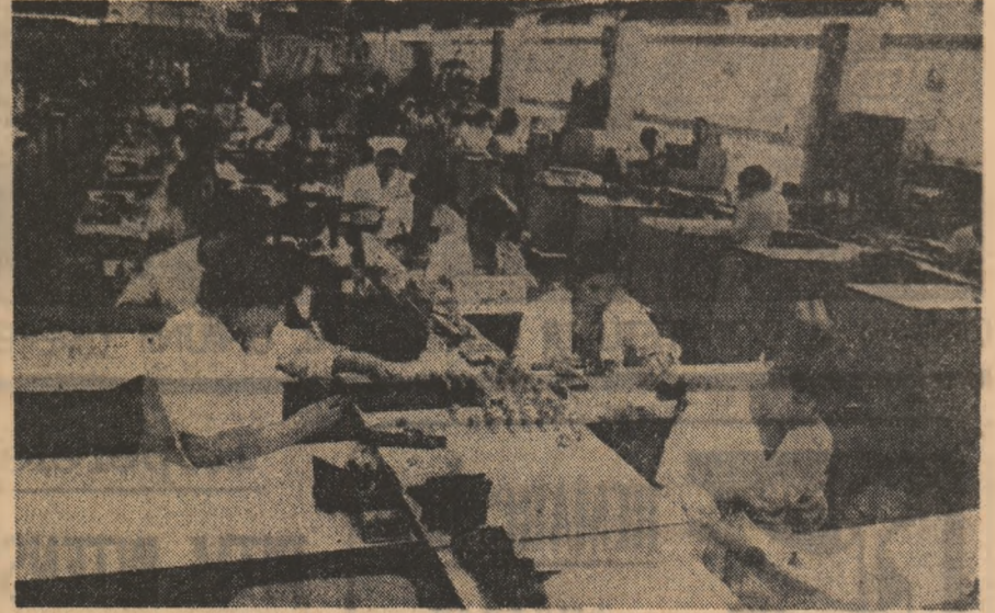
Organizațiile UTC. în munca lor de zi cu zi

de alimentare a hidroagregatelor. Deși, în această perioadă de timp, am avut o bună colaborare între toate departamentele și serviciile întreprinderii, totuși, în unele cazuri, am avut unele probleme de natură tehnică. Acestea au fost rezolvate în mod prompt și eficient de către oamenii de aici. În continuare, vom prezenta în continuare unele realizări deosebite ale oamenilor de aici, care sînt rezultatul unei activități energice și responsabile.