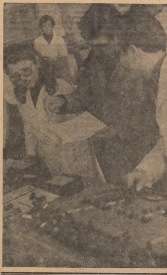
Pagina realizată de ALEXANDRU STROE