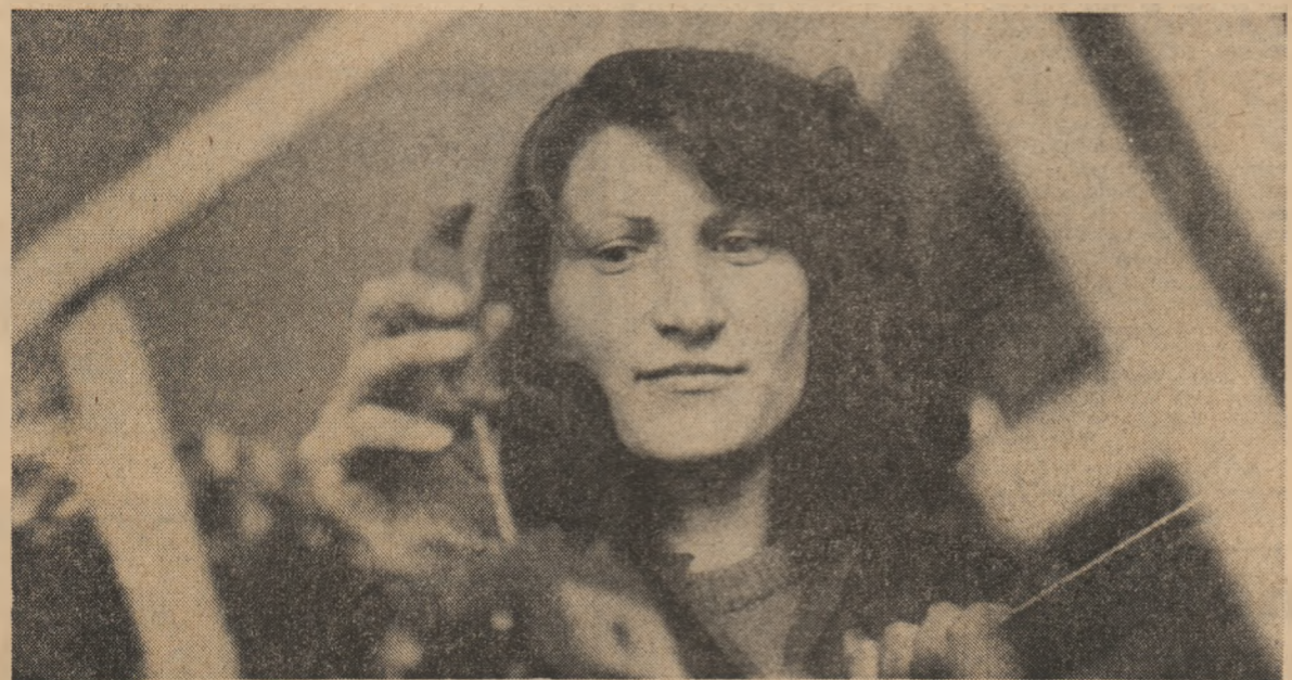
Pagină realizată de CONSTANTIN STAN

Botoșanii ocupă de acum un loc bine definit, printre județele țării. Platforma industrială a orașului Botoșani, desi mai nouă, și-a căpătat deja și ea personalitatea ei. Întreprinderile de la Dorohoi, de la Săveni, de la Dărăbani sînt și ele însemnele unei puternice deveniri industriale. Însă toate acestea, înțelese în contextul județului, exprimă o realitate: pasul imens făcut pe calea unei vieți libere, demne și ferice. Iar județul la rîndu-i exprimă, prin transformările sale, prin devenirea sa uluitoare, mai ales în ultimii 19 ani, transformările, devenirea întregii României socialiste.