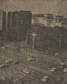
Imagine de ansamblu a Pieței „Rușin“ din Moscova

Secretar general al U.T.C.S. a fost ales Jesus Montero. La lucrările congresului a fost prezentă și o delegație a Uniunii Tineretului Comunist din țara noastră.