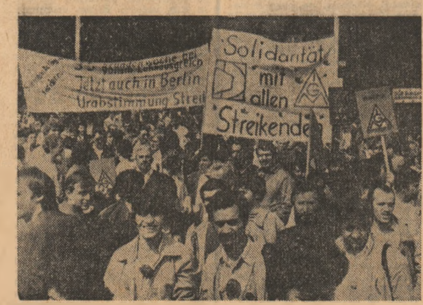
Numeroși muncitorii din industria metalurgică au demonstrat în Berlin occidental în fața porților uzinei Siemens, în semn de solidaritate cu colegii lor din R.F.G., aflați în grevă, cerînd îmbunătățirea condițiilor de muncă și viață

HAVANA 27 (Agerpres). — În orașul Cienfuegos, din Cuba, a avut loc festivitatea care a marcat împlinirea a 31 de ani de la asaltul asupra cazarmii Moncada — Ziua insurecției naționale cubaneze. Cu acest prilej, Fidel Castro Ruz, prim-secretar al C.C. al P.C. din Cuba, președintele Consiliului de Stat și al Consiliului de Miniștri ale Republicii Cuba, a rostit un amplu discurs. Referindu-se la succesele obținute de poporul cubanez, el a relevat că, în acest an, a fost realizată o producție-record de zahăr, una din cele mai mari din istoria țării. Totodată, Fidel Castro a declarat că țara sa va depune pe mal departe eforturi în direcția reducerii tensiunii în regiune și în lume și a reafirmat dispoziția Cubei de a continua negocierile inițiate de curînd cu S.U.A. pentru rezolvarea unor probleme ale conțenciosului cubanezo-american.