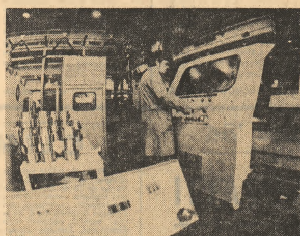
R. P. BULGARIA — Aspect de la Uzina metalurgică din Sofia, unde se folosește pe scară largă automatizarea

În anul 1966 a fost creat Institutul internațional pentru cercetarea păcii de la Stockholm pentru a marca o înclintură pozitivă în cursul secolului și jumătate de pace neîntreruptă a Suediei. Cunoscut în întreaga lume mai ales sub denumirea sa abreviată — S.I.P.R.I. — (Stockholm International Peace Research Institute) — acest institut își propune ca scop cercetarea problemelor păcii și conflictelor, abordînd în mod științific acele aspecte importante care privesc factorii de decizie politică din viața internațională. Obiectivul principal de cercetare l-au constituit pînă în momentul de față problemele vicinilor înarmării. Dezarmarea și controlul armamentelor S.I.P.R.I. reflectînd în lucrările sale atît evoluția, stadiul actual, cit și consecințele nefaste ale cursei înarmărilor, măsurile ce se impun pentru ca negocierile din domeniul dezarmării să ducă la rezultate efective.