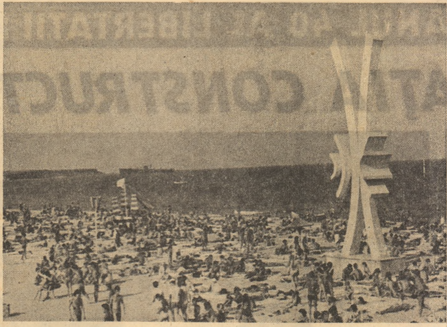
În aceste zile, la Costinești