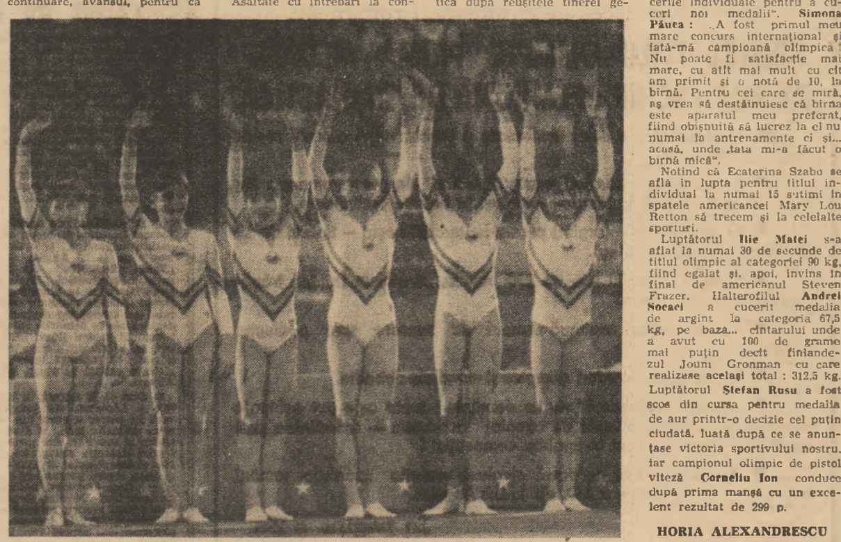
Asaltate cu întrebări la conferința de presă care a urmat, fetele noastre și-au mărit bucuria și marea mîndrie de a putea raporta îndeplinirea angajamentului asumat, exprimîndu-și totodată recunoștința față de conducerea partidului și statului nostru pentru condițiile minunate asigurate dezvoltării multilaterale a tinerii generații și, implicit, practicanții sportului de către întregul tineret al patriei.

Il s-au adăugat mereu mai valoroase reprezentante ale R.P. Chineze într-o competiție de mare nivel emoțional, din primul și pînă în ultimul schimb.