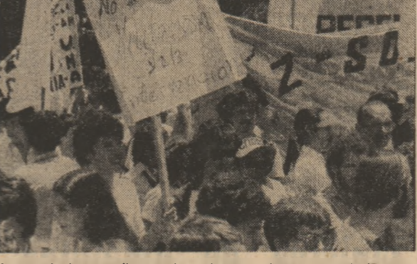
Aspect de la una dintre cele mai ample demonstrații desfășurate pînă în prezent la San Jose, capitala Republicii Costa Rica, în cadrul căreia mii de cetățeni și-au exprimat protestul împotriva politicilor de imitațiune practicate de S.U.A. în diferite țări din America Centrală