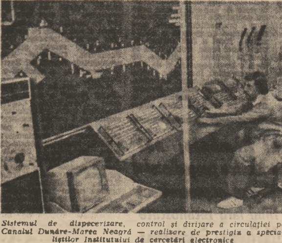
Sistemul de dispecerizare, control și dirijare a circulației pe Canalul Dunăre-Maree Neagră — realizare de prestigiu a specialiștilor Institutului de cercetări electronice