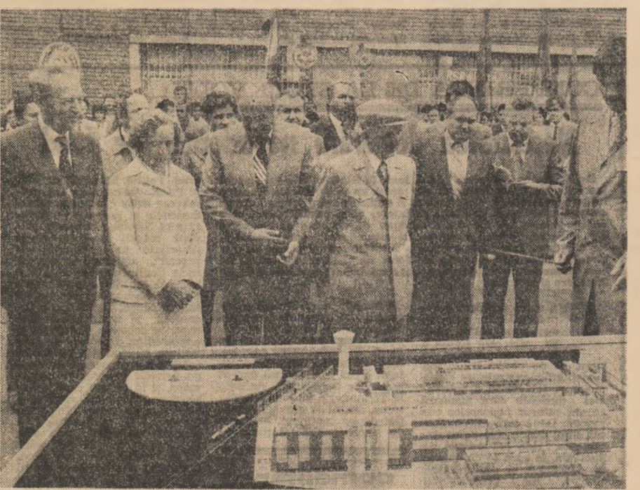
delungii aplauze, urale și ovatii. Se scândează cu înflăcărare numele partidului și al secretarului său general.

Multă sănătate și fericire. La revedere, dragi tovarășii. Pe stadion răsuna din nou im-