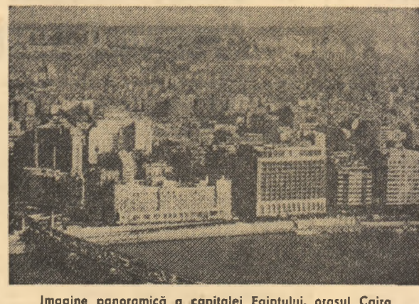
Imagine panoramică a capitalei Egiptului, orașul Cairo

● POPULAȚIA TURCIEI se ridică în prezent la 49.000.000 locuitori — se arată în raportul Institutului de Stat de Statistică, dat publicității la Ankara. La Istanbul trăiesc 5,5 milioane persoane, la Ankara — 3 milioane, iar la Izmir — 2,5 milioane.