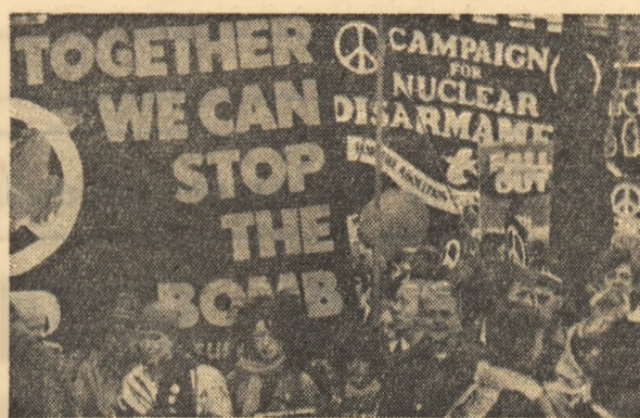
„Împreună, putem opri bomba!”. Iată, rezumat succint — pe parcursul purtat de participații la o manifestație desfășurată la Londra împotriva războiului, a cursei înarmărilor, pentru pace — un imperativ vital al timpului nostru

RIAD 19 (Agerpres). — Yasser Arafat, președintele Comitetului Executiv al Organizației pentru Eliberarea Palestinei, a conferit la Jeddah (Arabia Saudită) cu Habib Chatli, secretarul general al Organizației Conferinței Islamice, transmitind agenției gateraz de știri, Q.N.A.