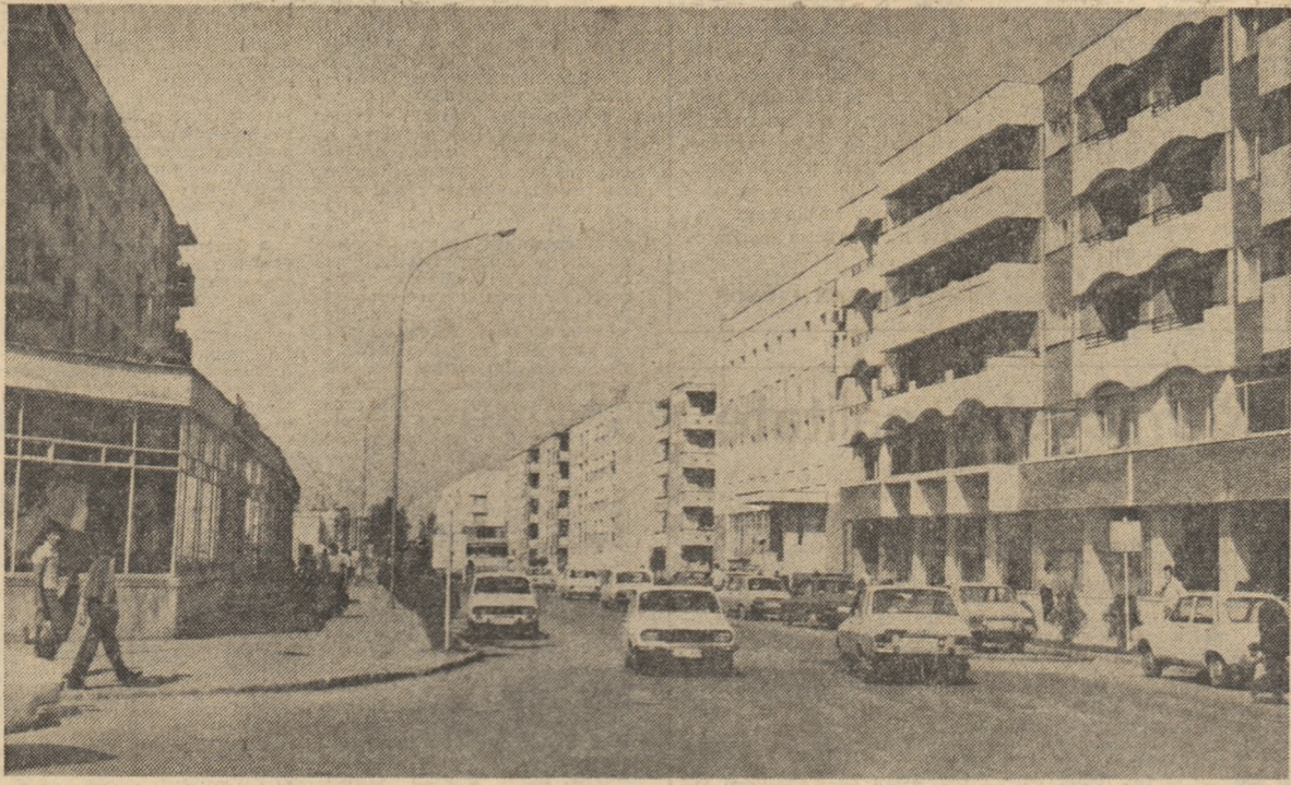
Focșani - unul dintre numeroasele orașe moldovene care pe harta țării a prins contururi arhitectonice moderne