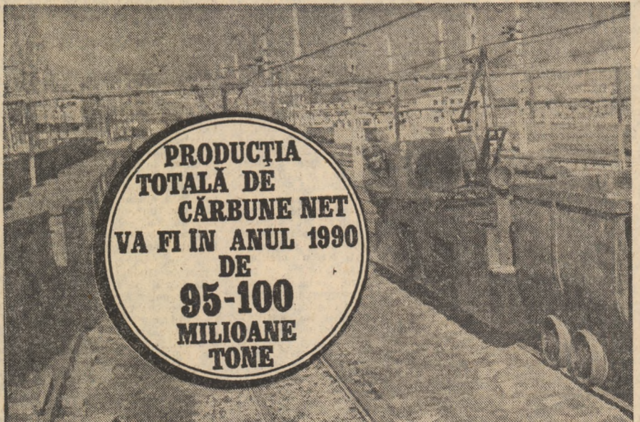
PRODUCȚIA TOTALĂ DE CĂRBUNE NET VA FI ÎN ANUL 1990 DE 95-100 MILIOANE TONE

„În industria extractivă se prevede aplicarea pe scară largă a metodelor de exploatare de mare productivitate. Producția de lignit și cărbune brun, de 84-89 milioane tone, se va realiza în proporție de peste două treimi în cariere. La hui! întreaga producție brută va fi supusă spălării în vederea creșterii în continuare a cantității de cărbune cocsificabil. În cincinalul viitor se va dezvolta extracția de sisturi bituminose, cariera de la Anina atingând capacitatea de profil”.