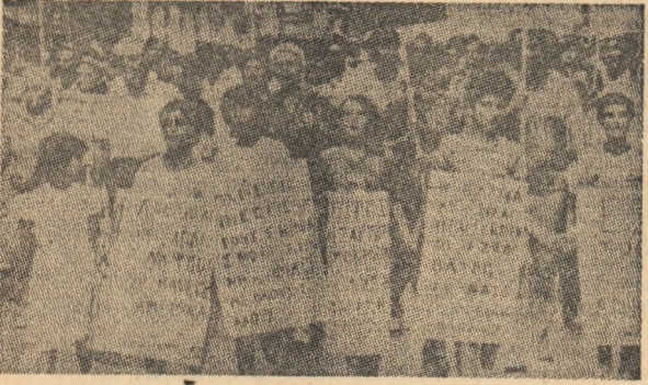
Aspect din timpul unei dintre demonstrațiile desfășurate în ultima vreme în Grecia împotriva prezenței bazelor militare ale N.A.T.O. pe teritoriul acestei țări

În pofida represaliilor, mineerii sud-africani sînt hotărîți să continue acțiunile greviste. Astfel, s-a anunțat că în aceste zile au început lucrul peste 4.000 de muncitori de la minele de aur din Durban, aparținînd companiei „Rand Mein Limited”. Sindacatul minerilor sud-africani, care totalizează peste 90.000 de membri, a anunțat că analizează posibilitatea unei greve generale.