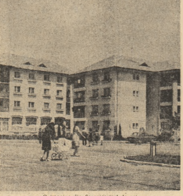
O imagine din Scorniceștii de azi