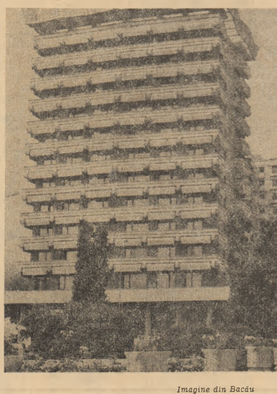
Imagine din Bacău

în sprijinul participanților la învățămîntul politico-ideologic al U.T.C. PERSPECTIVELE DEZVOLTĂRII ROMÂNIEI ÎN CINCINALUL 1986 — 1990 ȘI ORIENTĂRILE PRINCIPALE PÎNĂ ÎN ANUL 2000 PAGINA A 2-A