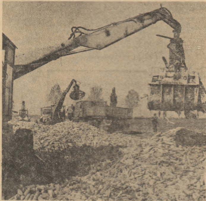
Agenda acțiunilor uteciste

Bogată toamnă românească. La ceas de bilanț, vredeții gospodari ai recoltelor aduc prinosul lor de recunoștință și acțiunilor dragoste față de cel mai iubit fiu al poporului, tovarășul Nicolae Ceaușescu, secretarul general al partidului, președintele țării, ctitor al celor mai înnoitoare transformări ale României socialiste, pilonului exemplar de muncă și activitate revoluționară pe drumul înfiorării multilaterale a patriei, a bunăstării neamului și a păcii pe planetă. Nimic mai adevărat ca piinea nu poate fi mesagerul și expresia deplină ale libertății, demnității și inteligenței, pasnica bătaie pentru zori de pământ și pășună, ducătoare de liniște și fericire. Țăranul român știe de cînd lumea acest adevăr pe care îl respectă cu sfințenie și îl transmite nealterat fiilor, generațiilor, prin însăși dragostea lui față de munca pămîntului.