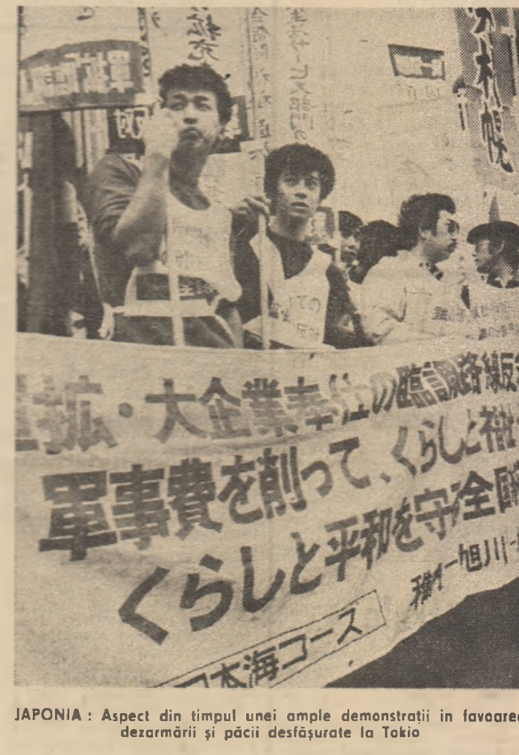
JAPONIA: Aspect din timpul unei ample demonstrații în favoarea dezarmării și păcii desfășurate la Tokio

BEIRUT 23 (Agerpres) — În multe localități din sudul Libanului forțele de securitate israeliene au realizat dezbateri speciale de desant în regiunea de coastă, ca măsură de represivă față de acțiunile partizanilor libanezi. Pe de altă parte, la Beirut și în zonele învecinate se menține acordarea în condiții intensificate a ciocnirilor armate dintre milițiile rivale libaneze. După cum transmisiune agenturii A.P. și U.P.I., șeful de artilerie din regiunea Sokh El Gharb s-a udat cu morți și răniți. Ca urmare a unor incidente în tabăra de refugiați Burj Barajneh, au fost luate măsuri speciale de securitate. Comandamentul armatei libaneze a declarat, într-o comunicație, că asemenea incidente periclitează procesul de normalizare și stabilizare a situației din țară și a cerut încetarea imediată a tulburărilor. BEIRUT 23 (Agerpres) — Guvernul Seneegalului a hotărât retragerea, până la sfîrșitul lunii octombrie, a contingentului senegelez din un efectiv de 500 de oameni din cadrul Forței Interimare a Națiunilor Unite în Liban (UNIFIL) — a anunțat, la Beirut, un purtător de cuvînt oficial, citat de agenția Kuna. Mai mult, în aceste zile, Franța și Nepal s-au oferit să completeze efectivele UNIFIL, care, în urma hotărârii guvernului de la Dakar, se va reduce la 5.200 oameni.