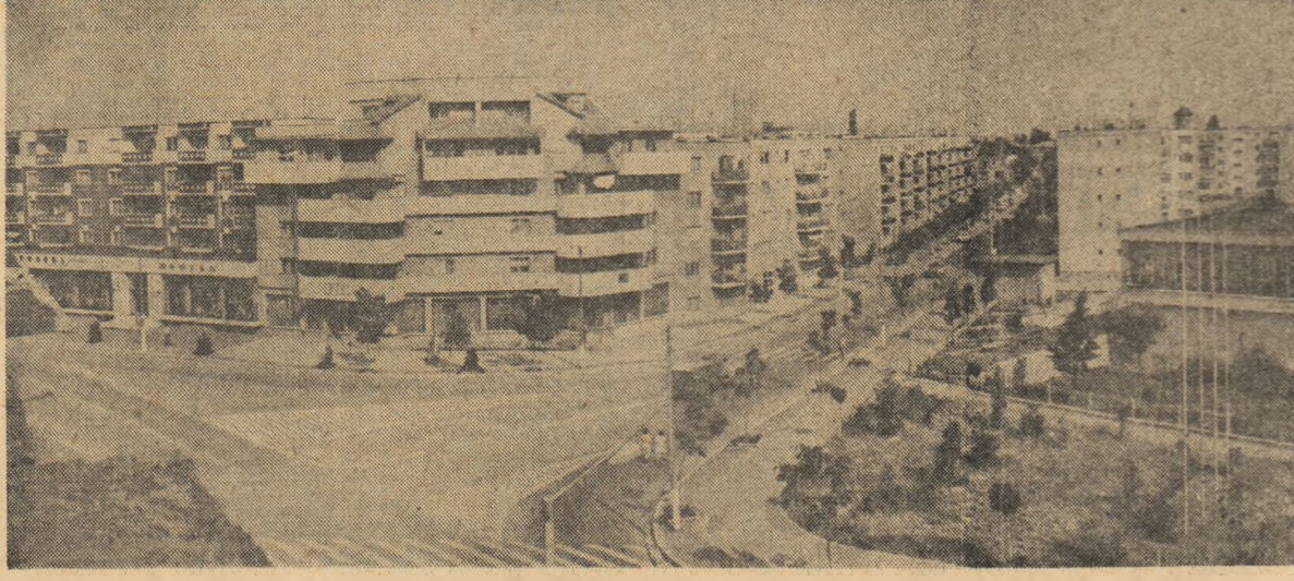
Rimnicu Sărat — oraș simbol al devenirii noastre economico-sociale

plin de fală. Istoria aspră și zbucnitoare a acestor locuri sînt scrise cu singele vîrșat acum 200 de ani, ca una din cele mai glorioase pagini ale neamului nostru. El se păstrează pentru noi și generațiile viitoare. Istoria Gorunului nu sî-a plecat trunchiul și coroana în fata altor coroane, fie ele de aur. Bătrînul gorun stă și veghează la singurul pe urmaș din prezență. Veghează să crească oblu către cer, cum sîc mîții, cu coroana și trunchiul neplesctor în fata nimănui, decît a neamului. Cu crengile aproape îneminate cu marea de boabe, un gorun de 18 ani i-a imprimat mîreția și fală. Este gorunul sădit în acel noiembrie al anului 1966 de însuși președintele României, Tituș deț de însuși Gorunul, înainte de a-și înfrîge rădăcinile în pămîntul Tebei, aceleași mîini îi îngropau rădăcina cu cîteva lopeti de pămînt sînt. Un cădu de apă din tip Apusilor i-a dat viața de dînti.