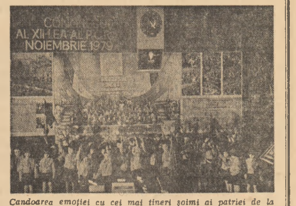
Candoarea emoției cu cei mai tineri poimi ai patriei de la Grădinița nr. 248 din sectorul 1 al Capitalei