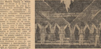
Un moment din concertul „Cântarea României” al tineretului.

Pe scena de spectacol al tineretului, formațiile artistice ale tineretului sunt puternic ancorate în realitate, expresii ale participării tinerilor la muncă și la viață. Aceste formații sunt caracterizate printr-un profesionalism ridicat și o opțiune clară față de artă.