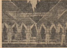
Un moment din concertul „Cântarea României” al tineretului.

Pe scena de spectacol al tineretului, formațiile artistice ale tineretului sunt puternic ancorate în realitate, expresii ale participării tinerilor la muncă și la viață. Aceste formații sunt caracterizate printr-un profesionalism ridicat și o opțiune clară față de artă.