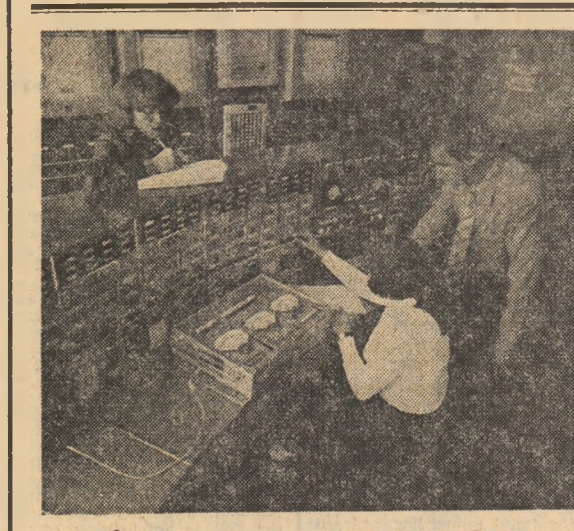
Insemnări din U.R.S.S.