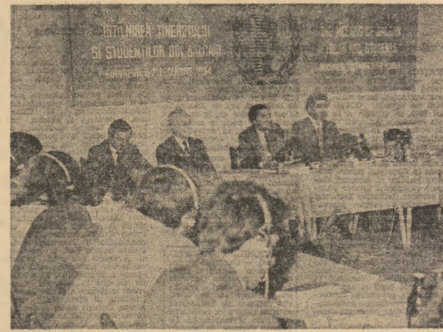
La București au început miercuri, 5 decembrie a.c. lucrările întîlnirii tineretului și studenților din Balcani...