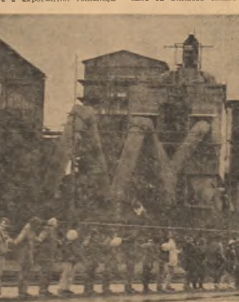
R.F. GERMANIA: „Să trăim în pace” este dorința comună a tuturor celor care au format în orașul Hesselbach și Duisburg, un larg sat în zona de frontieră de pace de la N.A.T.O.

Consiliul a salutat deschiderea Canalului Dunăre-Marea Neagră, exprimând încrederea că aceasta va contribui la dezvoltarea și facilitarea comerțului internațional, și a recomandat ca întreprinderile americane să utilizeze canalul.