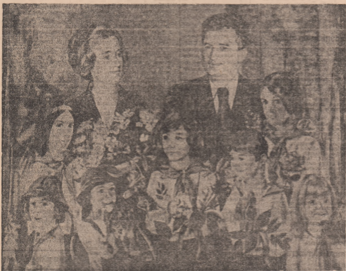
Pictură de ZAMFIR DUMITRESCU

Omagiu respectuos, dragostea fierbinte și recunoștința tinerei generații a patriei socialiste