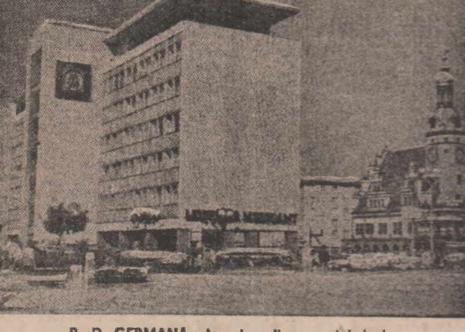
R. D. GERMANIA: Imagine din orașul Leipzig

DAMASC 29 (Agerpres). — Președintele Siriei, Hafez Al-Assad, l-a primit, la Damasc, pe Rashid Karame, primul ministru libanez, sosit în capitala siriană pentru a negocia cu oficialitățile țării-gazdă asupra ultimelor evoluții ale situației din Liban. Într-o declarație, premierul libanez a precizat că agenda negocierilor a cuprins probleme privind retragerea trupelor israeliene din sudul Libanului și situația economică a țării sale. El a afirmat că atât Libanul cât și Siria se opun amplasării elementelor armate separate și banete create și înarmate de Israel în sudul țării.