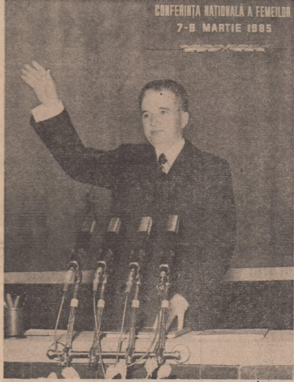
(Continuare în pag. 6 III-6)

In prezența tovarășului Nicolae Ceaușescu, secretar general al Partidului Comunist Român, președintele Republicii Socialiste România, joi, 7 martie, s-a început lucrările la București. Conferința națională a femeilor, eveniment politic de mare însemnătate, care pune în lumină rolul și contribuția crescândă a femeilor — puternică forță socială a orinduirii noastre socialiste — la progresul multilateral al patriei, la dezvoltarea liberă și independentă a României. Precedată de adunările și conferințele de dări de seamă și alegeri, conferința reprezintă o nouă și grațioasă expresie a profundului democratism al orinduirii noastre, care a creat condiții minunate pentru afirmarea depline a femeilor în toate sectoarele de activitate politică, economică și socială. Conferința constituie un nou prilej de reafirmare a voinței femeilor din țara noastră de a acționa, în strânsă unitate în jurul partidului, al secretarului său general, tovarășul Nicolae Ceaușescu, pentru transpunerea în viață a istoricilor hotărâri adoptate de Congresul al XIII-lea al P.C.R., a Programului de făurire a societății socialiste multilateral dezvoltate și înaintare a României spre comunism, a întregii politici interne și externe a partidului și statului nostru. În fața clădirii Radiofiziunii, în care se desfășoară lucrările conferinței, tovarășul Nicolae Ceaușescu, tovarășa Elena Ceaușescu, ceilalți tovarășii din conducerea partidului și statului au fost întâmpinați, la intrarea în sală,