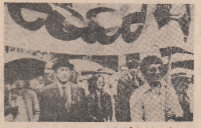
AUSTRALIA — Demonstrație desfășurată la Sydney împotriva cursei înarmărilor nucleare