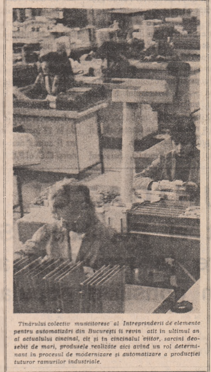
Tinerii colectivi muncitoresc al Intreprinderii de elemente pentru automatizări din București își revin, atât în ultimul an al actualului cincinal...