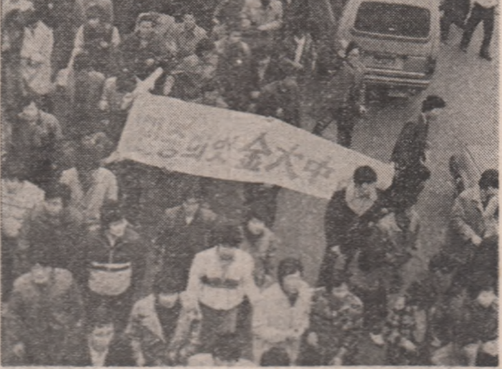
Aspect de la o amplă demonstrație a tineretului din Coreea de Sud împotriva politicii antipopolare și antidemocratice a regimului de la Seul