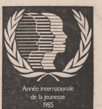
Année internationale de la jeunesse 1985

acurate tineretului, semnificațiilor obiectivelor generoase ale A.I.T., pentru tineretul din Columbia și țara generată de pretutindeni.