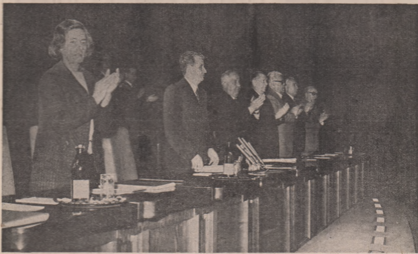
energiilor crescătoare ale oamenilor muncii la îndeplinirea exemplară a hotărârilor Congresului al XIII-lea al partidului.

Plenara a indicat organelor și organizațiilor de partid să ia măsuri hotărâte și să acționeze, cu toată fermitatea, pentru perfecționarea, în continuare, a stilului și metodelor de muncă, pentru întărirea controlului asupra modului în care se îndeplinesc hotărârile de partid, pentru creșterea capacității organizațiilor de partid în utilizarea și mobilizarea