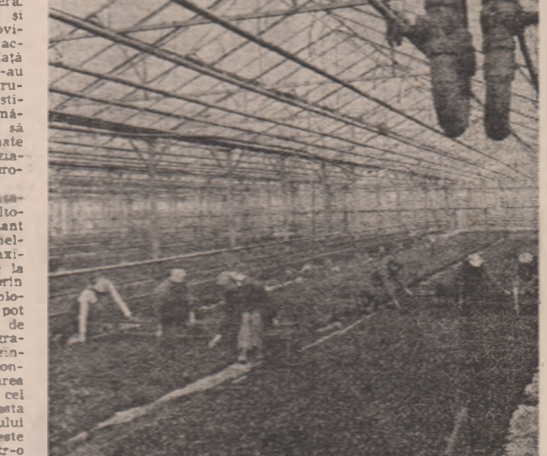
Reparația răsodurilor la seara din Bascon a I.P.L.F. Pitești

Toate forțele satului angajate în activitățile de sezon