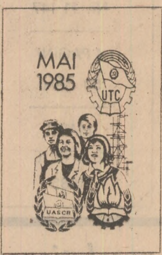
Prin-o amplă mobilitare, colectivul întreprinderii noastre...

Richard von Weizsäcker, președintele Republicii Federale Germania; Saddam Hussein, președintele Republicii Irak. Colonel Masouva Ould Sidi Ahmed Taya, președintele Comitetului Militar de Salvare Națională, șef al Statului Republicii Islamice Mauritania;