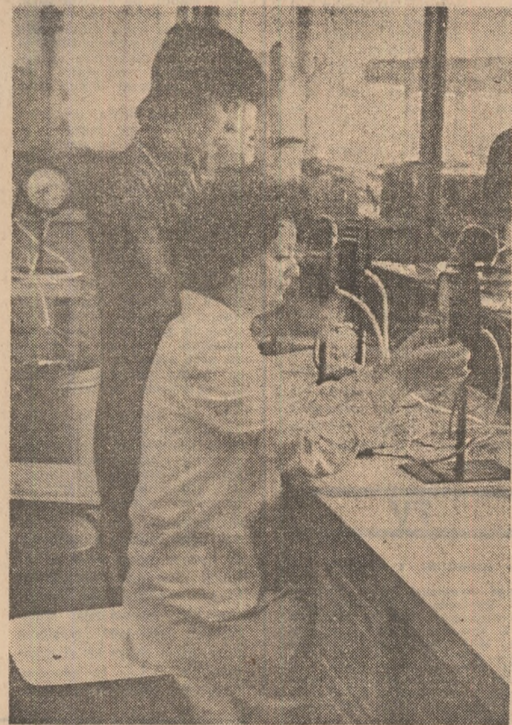
Activitate responsabilă, exigentă la I.A.M.C. Vaslui

Cristalul definește munca colectivului acestei întreprinderi, însă pe drumul de la cuarțul de Uricani la articolele de mare finețe și frumusețe acesta parcurge o cale lungă, care nu ar putea fi strălucită fără contribuția tuturor. CRISTIAN DUMITRESCU (Continuare în pag. a II-a)