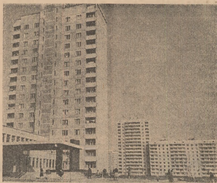
U.R.S.S. — Imagine a orășelului studentesc din Munkacs

Luind cuvântul în fața participanților, președintele țării gazdă, Denis Sassou Nguesso, a adresat un apel tuturor țărilor de pe continent de a-și uni eforturile în vederea lichidării definitive a vestigiilor colonialismului și rasismului de pe pământul african, pentru emanciparea economică a tuturor statelor Africii.