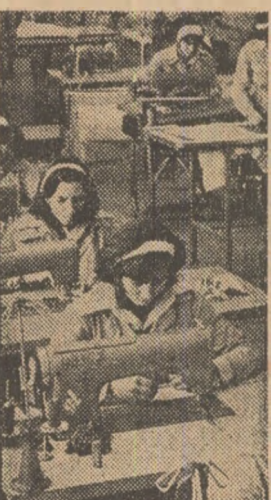
RECORDURI ÎN MUNCA ȘI CALITATE

Hotărâți să-și aducă din plin contribuția la depășirea indicatorilor de plan, la livrarea unor produse suplimentare și de calitate superioară, tinerii din marile unități industriale ale județului Iași participă în această săptămână la ample acțiuni de muncă patriotică în sprijinul producției. Rezultatele acestor inițiative ale tinerilor vor fi reprezentate de cele 15 tone de produse turnate, 35 tone componente pentru morile de măcinat, 1 000 bucați confecții destinate exportului — realizate suplimentar sarcinilor de producție planificate.