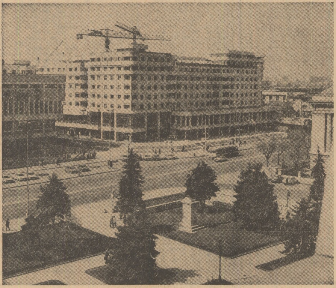
Imagine din Ploiești